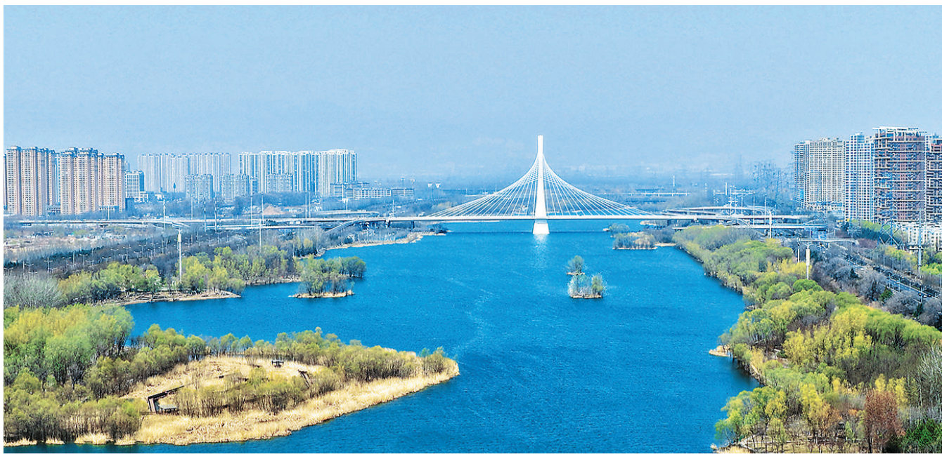
山西系统推进汾河中上游山水林田湖草沙生态保护修复——