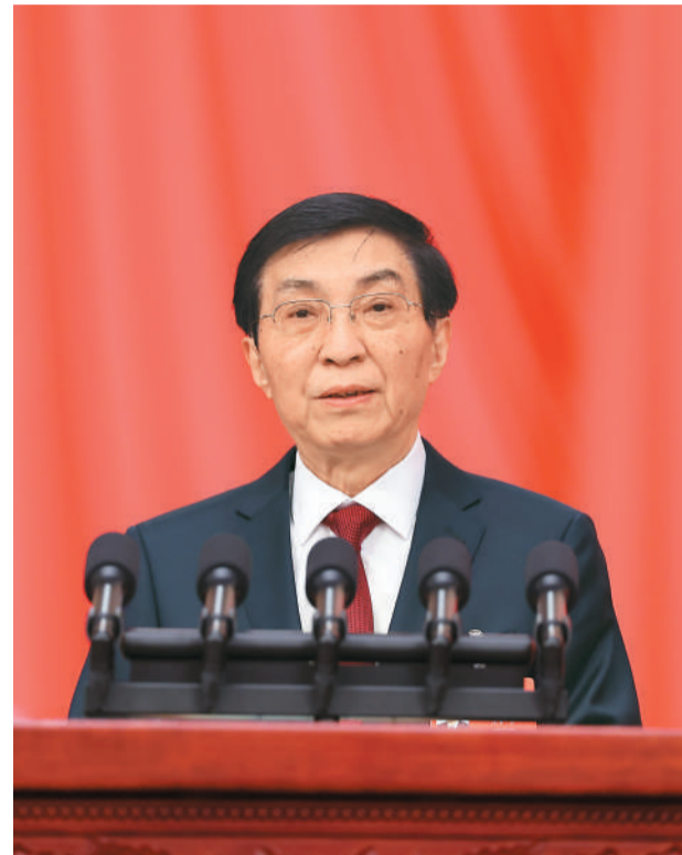
全国政协主席王沪宁代表政协第十四届全国委员会常务委员会,向大会报告工作。