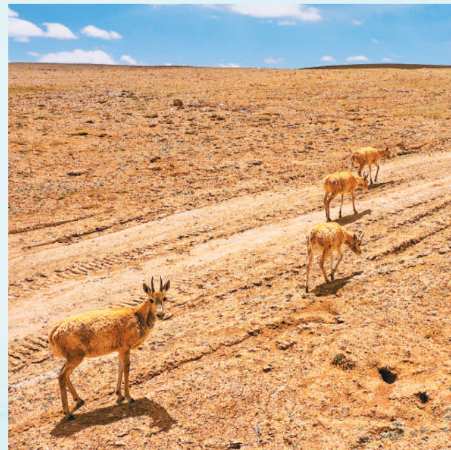
可可西里国家级自然保护区内，一群藏羚羊正在行走觅食。