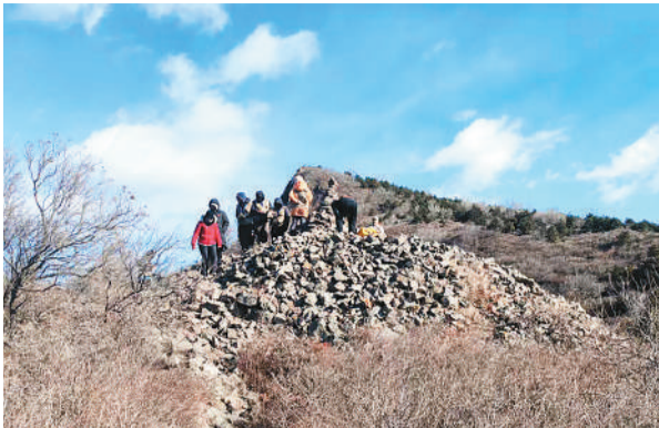
北京延庆区文物普查中，新发现了长城遗迹痕迹。

相关负责人表示，本次展览是以现代科技赋能传统文化表达的新实践。通过科技手段的运用，展览变得可亲可感。