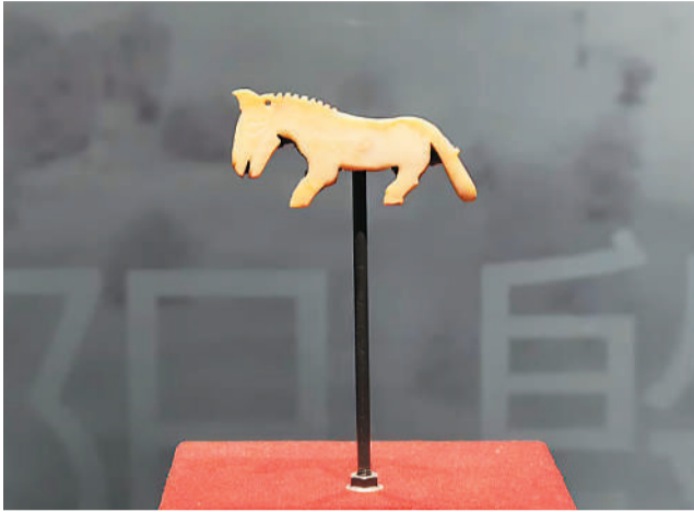
展览展出的河南安阳殷墟妇好墓出土的玉马。