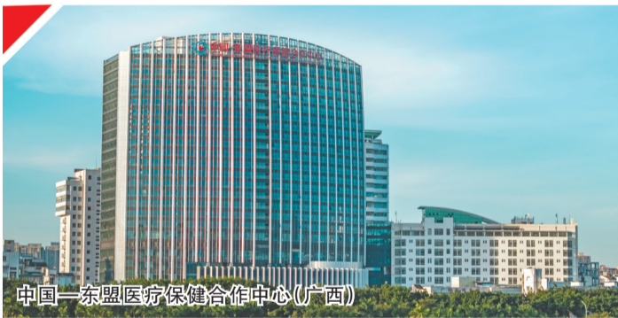
中国—东盟医疗保健合作中心（广西）

2025年，广西全力推动“人工智能+医疗”创新应用。探索建立自治区级医用设备产品采购信息库管理系统；印发实施相关行动方案和改革措施，发布第一批10个“人工智能+医疗”示范场景，推动“三医”数据协同和智能化转型，让政策红利精准直达群众。