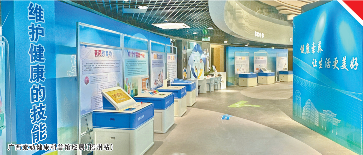
广西流动健康科普馆巡展（梧州站）