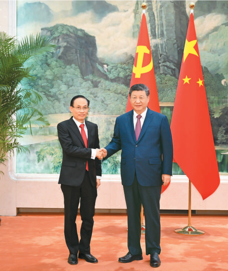
2月4日下午，中共中央总书记、国家主席习近平在北京人民大会堂会见作为越共中央总书记苏林特使专程来访的越共中央政治局委员、外交部长黎怀忠。