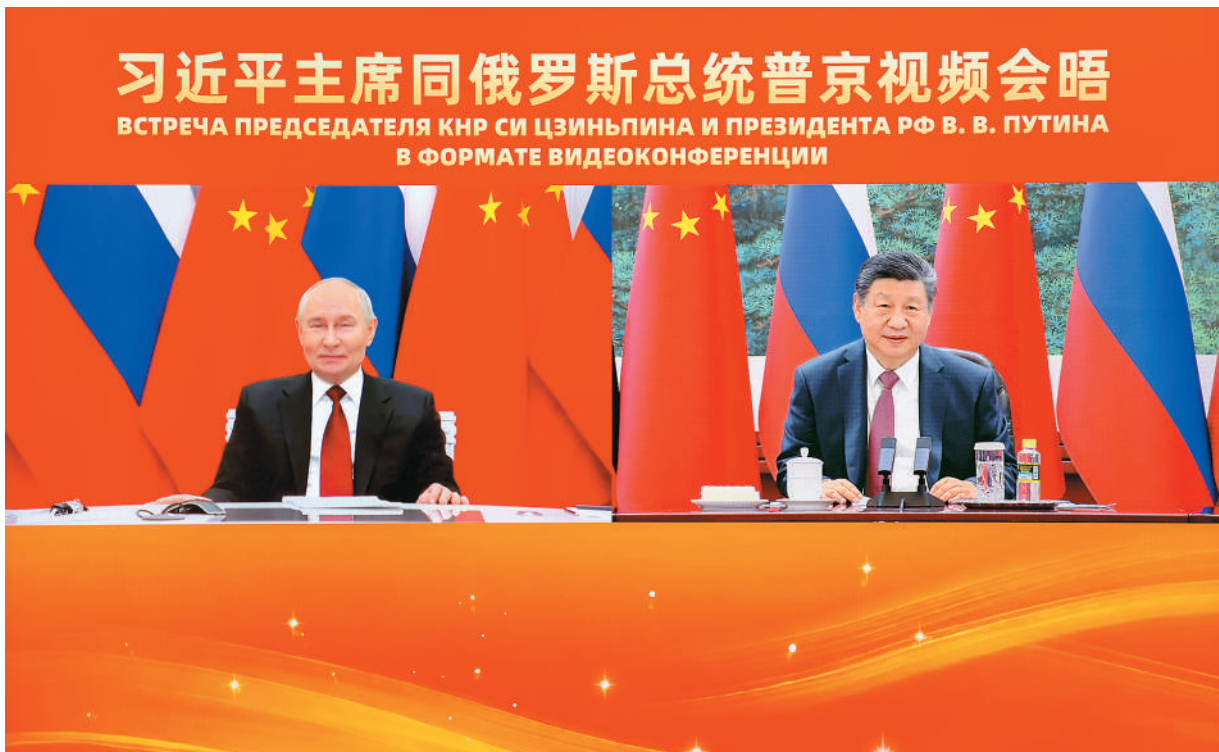
2月4日下午，国家主席习近平在北京人民大会堂同俄罗斯总统普京举行视频会晤。