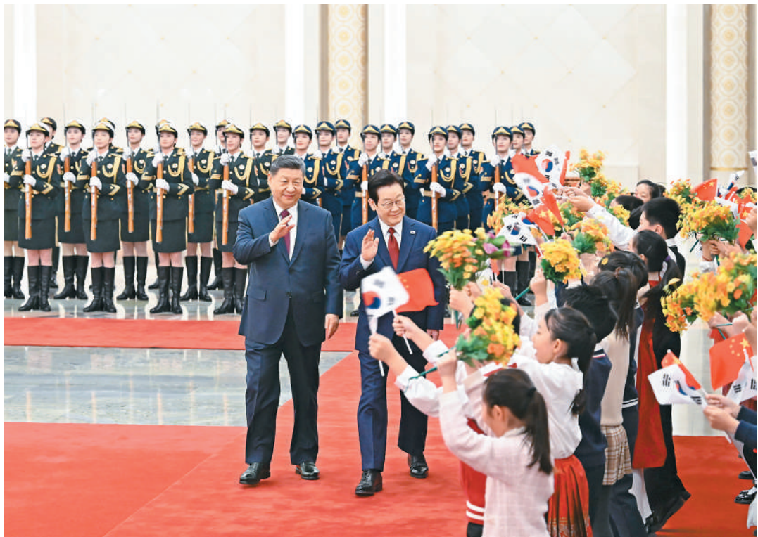
一月五日下午，国家主席习近平在北京人民大会堂同来华进行国事访问的韩国总统李在明举行会谈。这是会谈前，习近平在人民大会堂北大厅为李在明举行欢迎仪式。

新华社北京1月5日电（记者冯歆然、曹嘉琪）1月5日下午，国家主席习近平在北京人民大会堂同来华进行国事访问的韩国总统李在明举行会谈。 习近平向韩国人民致以诚挚新年祝福。习近平指出，我和李在明总统已两次见面并实现互访，体现了双方对中韩关系的重视。作为朋友和邻居，中韩应该多走动、常来往、勤沟通。中方始终将中韩关系置于周边外交重要位置，对韩政策保持连续性、稳定性。中方愿同韩方一道，牢牢把握友好合作方向，秉持互利共赢宗旨，推动中韩战略合作伙伴关系沿着健康轨道迈进，切实增进两国人民福祉，为地区乃至世界和平与发展正向赋能。 习近平强调，中韩两国长期坚持“以和为贵”“和而不同”，超越社会制度和意识形态差异，相互成就、共同发展。双方应延续这一优良传统，不断增进互信，尊重各自选择的发展道路，照顾彼此核心利益和重大关切，坚持通过对话协商妥善解决分歧。中共二十届四中全会审议通过“十五五”规划建议，为未来5年中国发展擘画蓝图，也为世界各国提供广阔机遇。中韩经济联系紧密，产业链供应链深度互嵌，合作互惠互利，要加强发展战略对接和政策协调，做大共同利益蛋糕。在人工智能、绿色产业、银发经济等新兴领域打造更多合作成果。双方要增进人员往来，开展青少年、媒体、体育、智库、地方等方面交往，让正面叙事成为民意主流。 习近平指出，当前世界百年变局加速演进，国际形势更加变乱交织。中韩在维护地区和平、促进全球发展方面肩负重要责任，有广泛利益交集，应当坚定站在历史正确一边，作出正确战略选择。80多年前，中韩两国付出巨大民族牺牲，赢得抗击日本军国主义的胜利。今