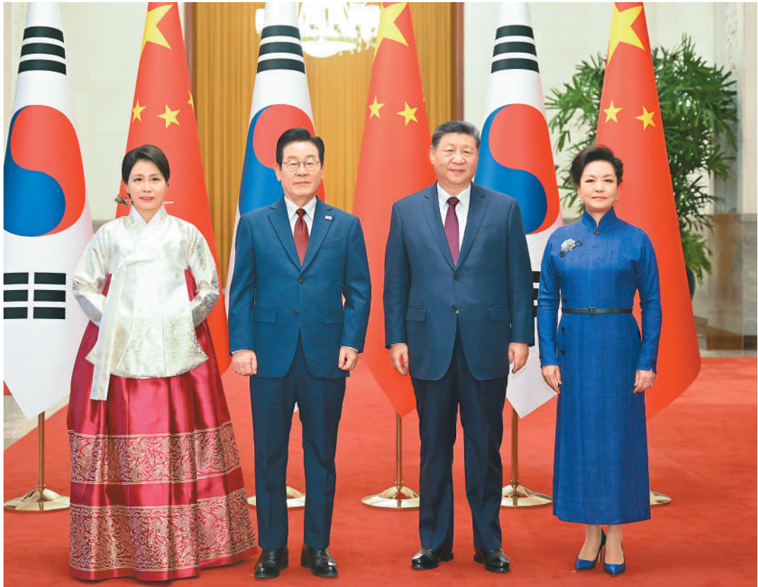
一月五日下午，国家主席习近平在北京人民大会堂同来华进行国事访问的韩国总统李在明举行会谈。这是会谈前，习近平和夫人彭丽媛同李在明和夫人金惠景合影。