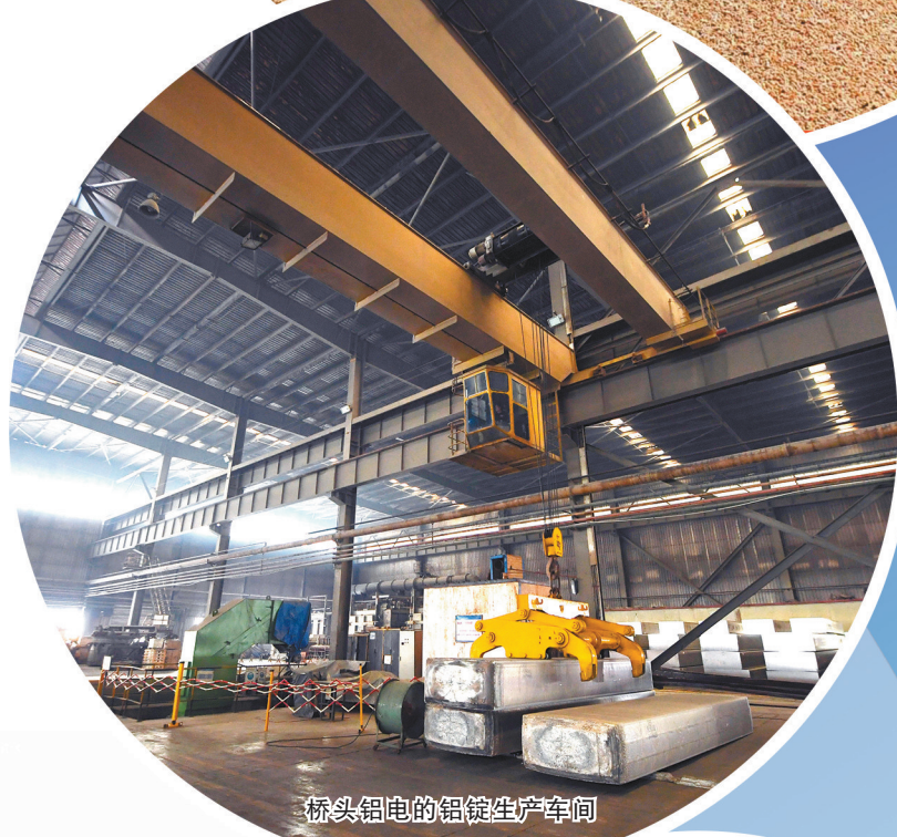
桥头铝电的铝锭生产车间