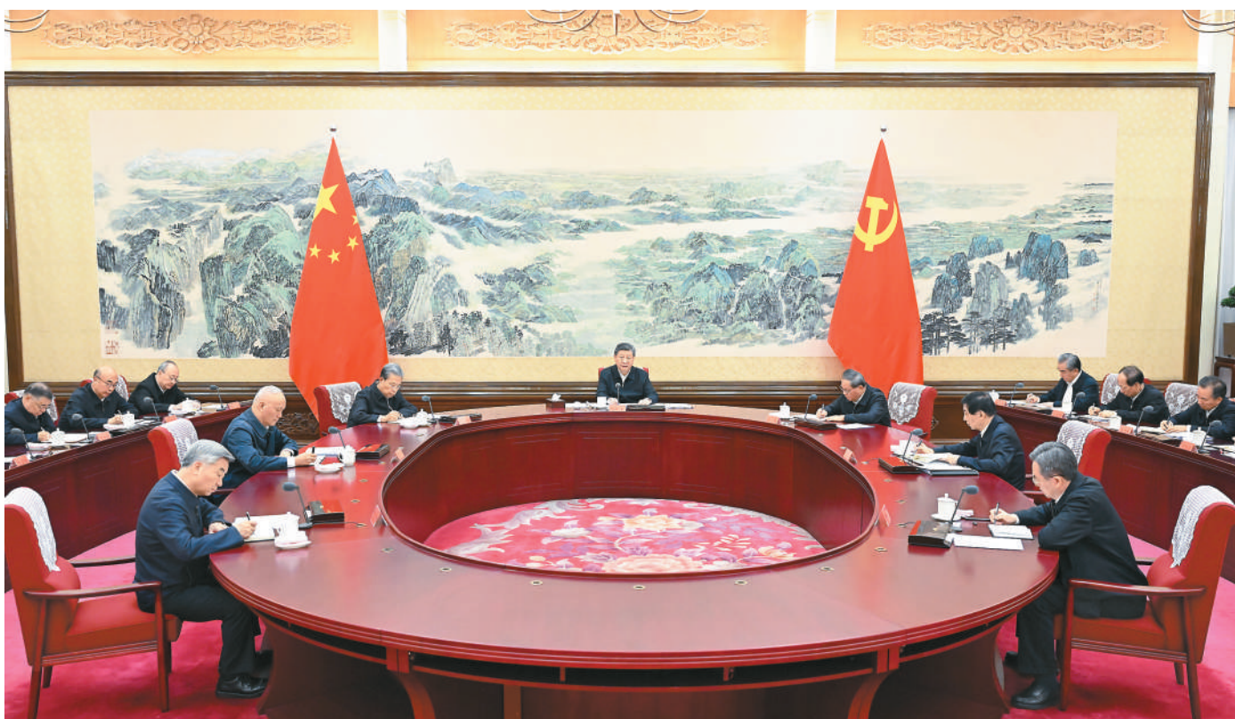
12月25日至26日，中共中央政治局召开民主生活会，中共中央总书记习近平主持会议并发表重要讲话。