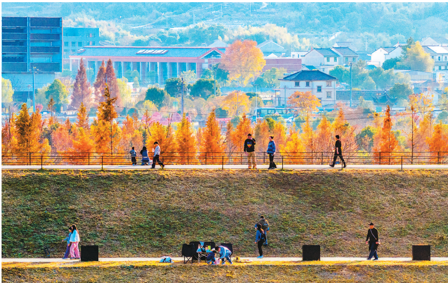
进入冬季，浙江省绍兴市上虞区上浦凤凰山遗址公园水杉林树叶陆续泛黄变红，色彩斑斓的水杉林在冬日暖阳映照下美如画卷，吸引不少市民和游客前来赏景游玩。图为12月7日，游客在凤凰山遗址公园游玩。