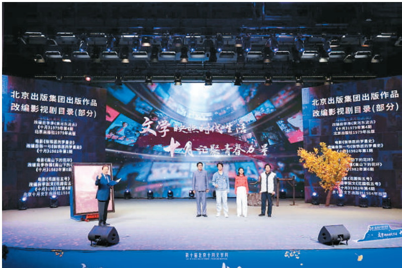
瞿弦和（左一）与青年演员共同演绎《没有纽扣的红衬衫》《平凡的世界》《北上》等作品中的经典片段。

青年写作关乎文学的未来。“王蒙青年作家支持计划”旨在扶持40岁以下的优秀青年作家，鼓励他们创作体现时代精神的精品力作。第四届“王蒙青年作家支持计划·年度特选作家”为周宏翔、林为攀、