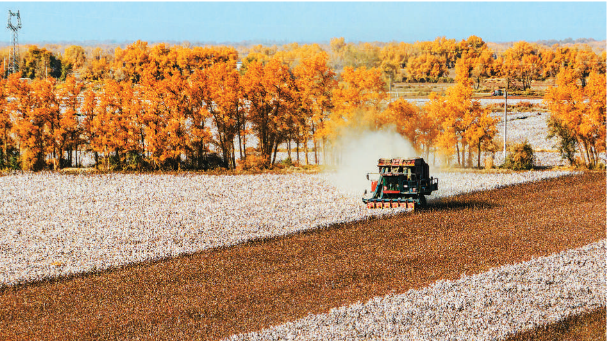
近期, 新疆维吾尔自治区巴音郭楞蒙古自治州尉犁县的棉花进入采收季, 当地使用机械化采棉手段, 大幅提高作业效率。图为尉犁县兴平镇孔雀村的高标准农田里, 国产采棉机在棉田里来回穿梭, 采收棉花。

“我专门来看看你们。” 2019年春节前夕, 北京前门石头胡同里, 习近平总书记来到快递服务点, 一句亲切问候, 温暖了寒冬中忙碌的“小蜜蜂”。 (下转第四版)