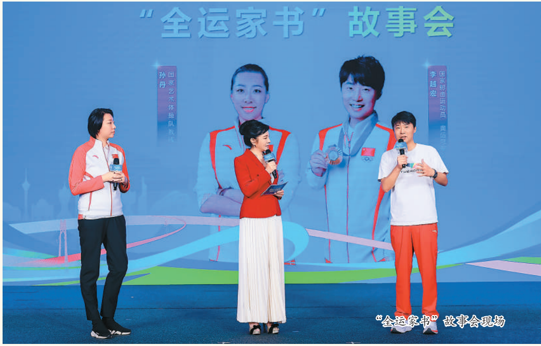
“全运家书”故事会现场