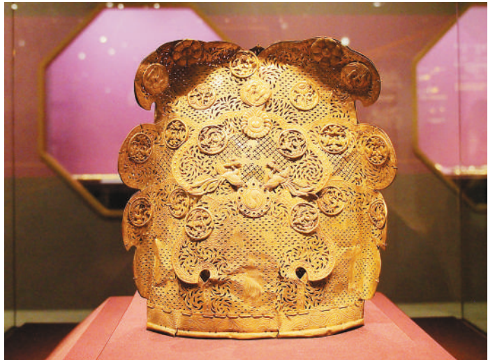
辽代双凤戏珠纹卷云冠。

辽代双凤戏珠纹卷云冠由16片形状如云朵的镂空金属片连缀拼合而成，上面还有22枚鎏金圆片，饰有菊花、鸚鵡、雁、飞鸟、太极图案，其纹饰具有典型的中原文化元素。宋代云凤形簪由锤揲、镂空、卷边等工艺制成，簪首处有一对凤鸟翩然欲飞。凤鸟的身体、翅膀与花卉部分由两块银片制成，再通过卷边合成，然后用银丝制作出凤鸟背部的螺旋，最后连接于鎏金簪脚。这对凤簪造型与辽代凤簪相似，却以中原流行的工艺制作，反映了这一时期南北饰物渐趋相似的趋势。据悉，展览将持续至2026年3月1日。