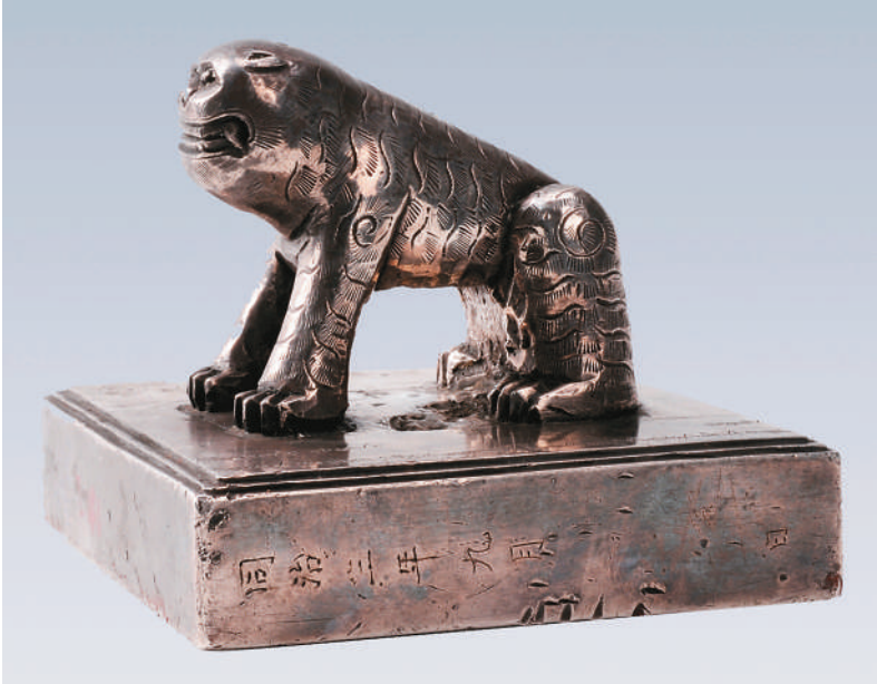
清同治三年江南长江水师提督银印。

安徽省蚌埠市位于中国南北地理分界线上，淮河穿城而过，孕育出独特的文明形态和城市风貌。这里有历史悠久的双墩文化，流传着大禹治水的动人故事，见证了近现代工业发展和社会变革的浪潮。1974年成立的蚌埠市博物馆，馆藏文物上万件，有“流动的文明——淮河历史文化陈列”“孕沙成珠——蚌埠历史文化陈列”“梳影宝鉴——馆藏精品铜镜展”等常设展览，2020年被评为国家一级博物馆。近日，记者走进这里，感受这座与淮河相伴而生的城市博物馆的独特魅力。