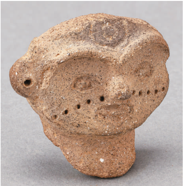
新石器时代双墩文化陶塑题纹面人头像。