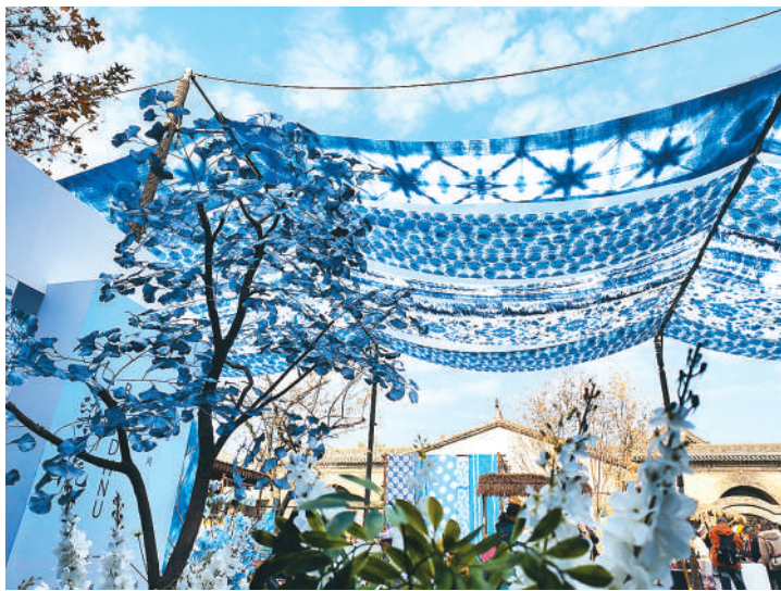
张壁古堡中展出的扎染作品。

活动当天，2025国家级文化生态保护区建设研讨会同步举办。来自江西、山东、河南、广东、广西、贵州、云南、山西等地的专家学者、文化生态保护区代表围绕“文化生态的整体性保护与创新发展”展开对话。