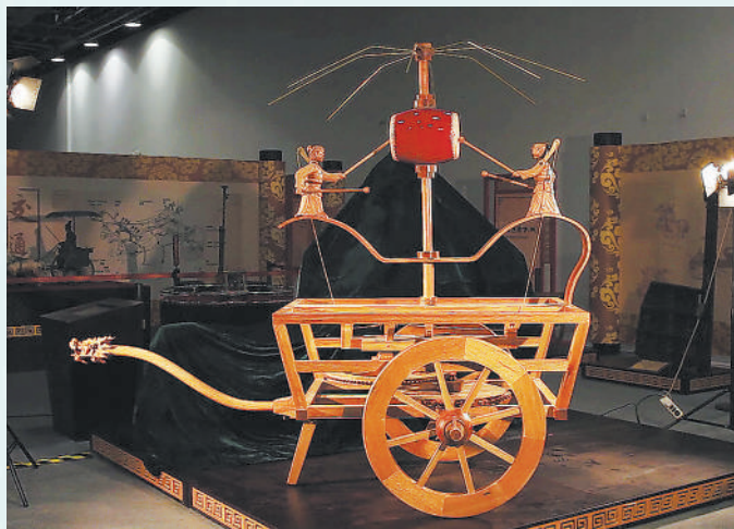
中国科学技术馆展出的记里鼓车复原模型。

记里鼓车蕴含的古代智慧至今仍令人赞叹。其通过车轮转动圈数来记录里程的设计原理，与今天汽车里程记录的基本原理是一致的。今天，如果你有机会走进中国科学技术馆，在“华夏之光”展厅就可以看到一台复原的记里鼓车模型，不妨亲自操作、探索体验，与千年前的能工巧匠展开一场跨越时空的对话。