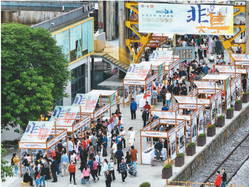
东湖意库原来是江西省南昌市东湖区一处老厂房仓库，通过功能改造和空间更新，“化身”为一个传统与现代交融的城市文创空间，助推当地文旅产业发展。图为“2025江西非遗大集”现场人头攒动。

“旅游+文化”给各地旅游增添了不少“文化味”。《印象·刘三姐》《印象·普陀》《印象·太极》等项目，用实景演出形式呈现当地历史文化，吸引大量游客。此外，“跟着演出去旅行”成为新