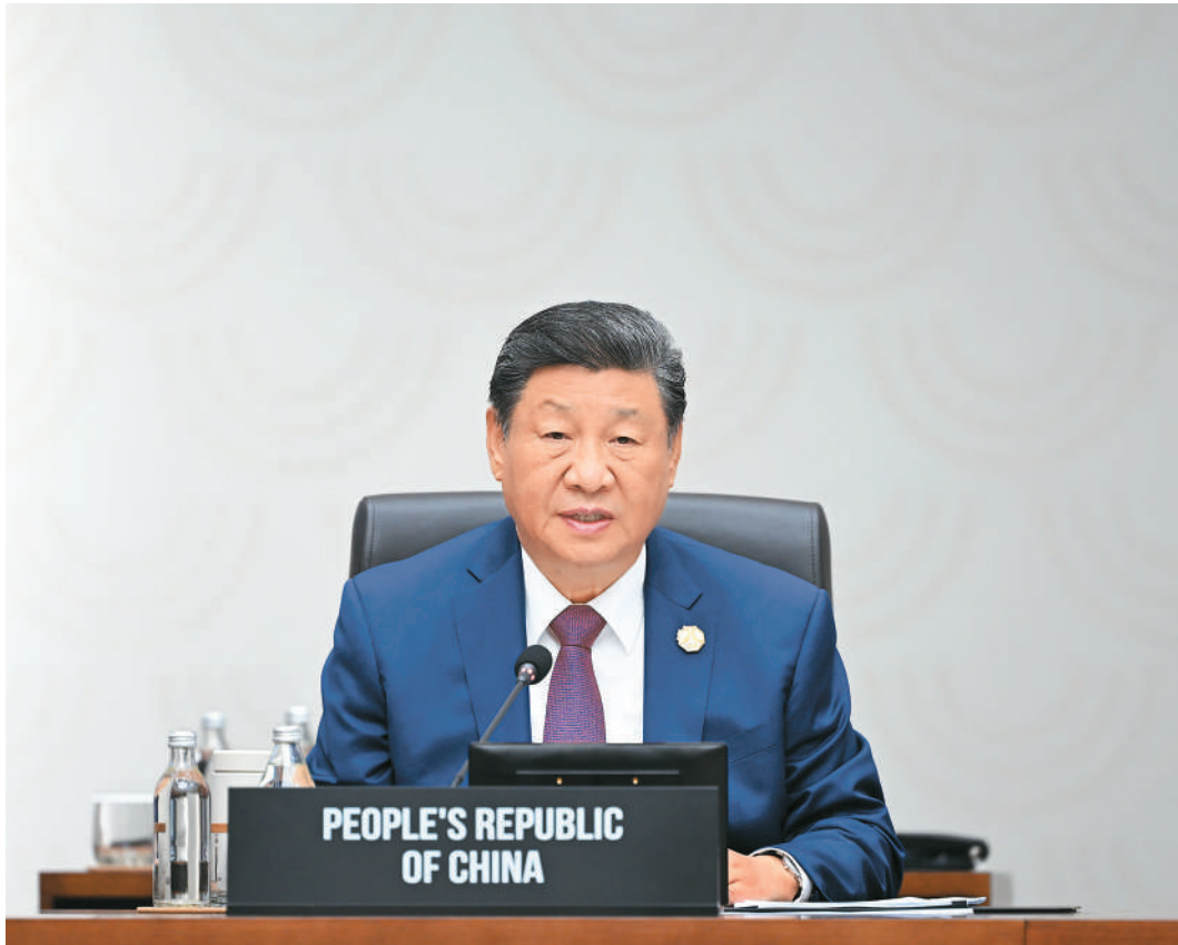
当地时间11月1日上午,国家主席习近平在韩国庆州出席亚太经合组织第三十二次领导人非正式会议第二阶段会议,并发表题为《共同开创可持续的美好明天》的重要讲话。