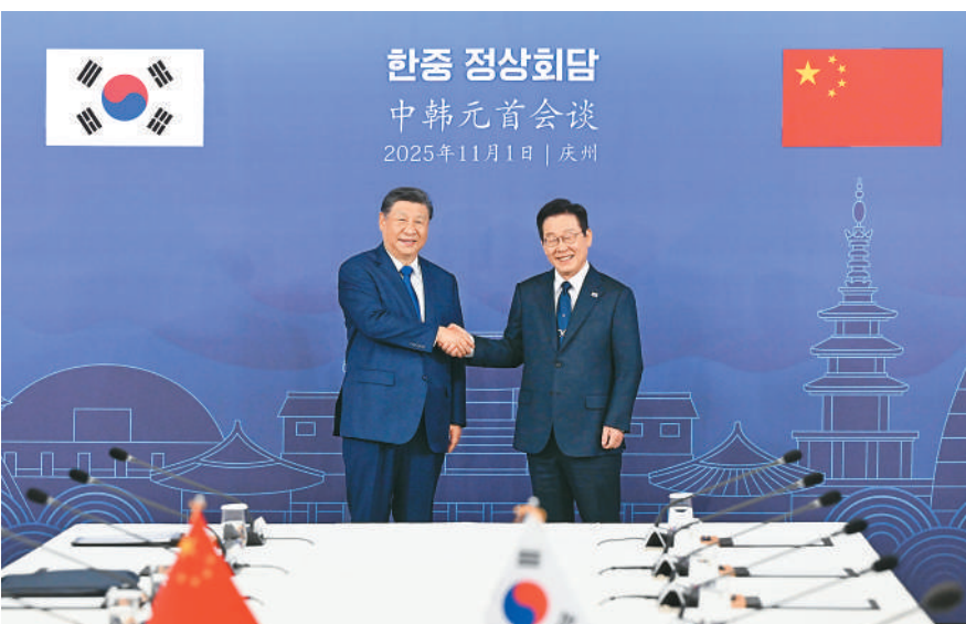
当地时间11月1日下午,韩国总统李在明同中国国家主席习近平在庆州博物馆举行会谈。

本报韩国庆州11月1日电(记者马菲、巩喆)当地时间11月1日下午,韩国总统李在明同中国国家主席习近平在庆州博物馆举行会谈。 11月的庆州,秋意正浓。习近平乘车抵达,韩国礼仪队隆重欢迎。 李在明热情迎接习近平。两国元首握手合影。 习近平同李在明登上检阅台。军乐团奏中韩两国国歌。习近平在李在明陪同下检阅仪仗队。两国元首分别同对方陪同人员握手致意。 欢迎仪式后,两国元首举行会谈。 习近平指出,中韩是搬不走的重要近邻,也是分不开的合作伙伴。建交33年来,两国超越社会制度和意识形态差异,积极推进各领域交流合作,实现了相互成就、共同繁荣。事实证明,推动中韩关系健康稳定发展,始终是符合两国人民根本利益、顺应时代潮流的正确选择。中方重视中韩关系,对韩政策保持连续性、稳定性,愿同韩方加强沟通,深化合作,拓展共同利益,携手应对挑战,推动中韩战略合作伙伴关系行稳致远,为地区和平与发展提供更多正能量。 习近平就开辟中韩关系新局面提出4点建议。 一是加强战略沟通,夯实互信根基。从长远角度看待中韩关系,在彼此尊重中共同发展,在求同存异中合作共赢。尊重各自社会制度和发展道路,照顾彼此核心利益和重大关切,通过友好协商妥善处理矛盾分歧。 (下转第三版)