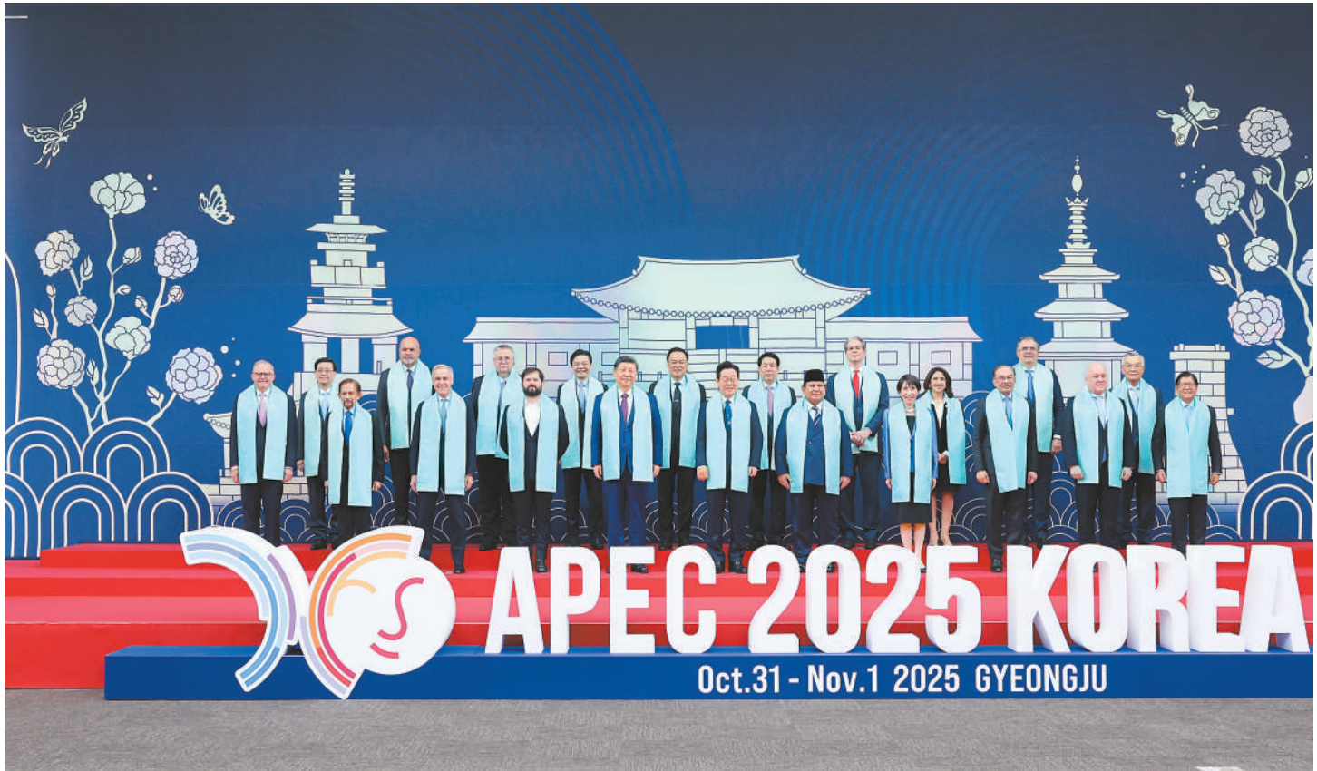
当地时间11月1日上午,国家主席习近平在韩国庆州出席亚太经合组织第三十二次领导人非正式会议第二阶段会议,并发表题为《共同开创可持续的美好明天》的重要讲话。这是会后,与会经济体领导人、代表集体合影。

■当前,新一轮科技革命和产业变革深入发展,为人类社会开辟了新前景。同时,世界经济增长动能不足,全球发展赤字扩大,气候变化、粮食和能源安全等挑战加剧。亚太各经济体应该加强互利合作,把握新机遇,应对新挑战,共同开创可持续的美好明天 ■提出3点建议:一是强化数智赋能,塑造亚太创新发展新优势。二是坚持绿色低碳,打造亚太可持续发展新范式。三是落实普惠共享,展现亚太包容发展新气象