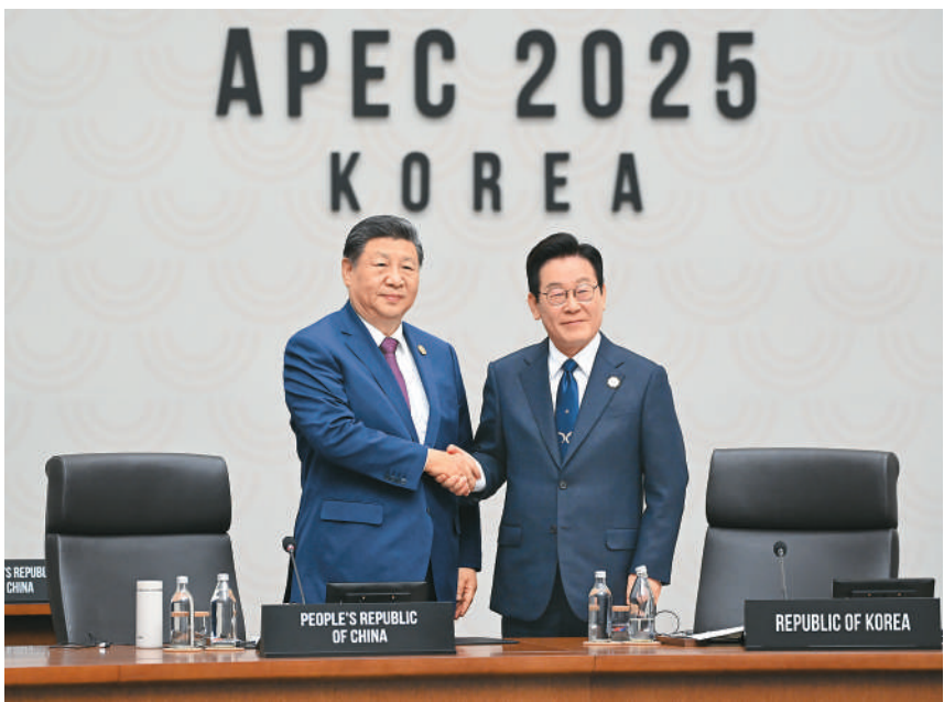
当地时间11月1日上午,国家主席习近平出席亚太经合组织第三十二次领导人非正式会议东道主交接环节,宣布中方将于明年11月在广东省深圳市举办亚太经合组织第三十三次领导人非正式会议。这是习近平同韩国总统李在明在交接环节上握手。

本报韩国庆州11月1日电(记者陈尚文、王梓)当地时间11月1日上午,国家主席习近平出席亚太经合组织第三十二次领导人非正式会议东道主交接环节,宣布中方将于明年11月在广东省深圳市举办亚太经合组织第三十三次领导人非正式会议。 习近平强调,亚太经合组织是亚太地区最重要的经济合作机制,为促进亚太地区增长和繁荣作出了重要贡献。构建亚太共同体是实现亚太地区长远发展繁荣的必由之路,也是各方的共同愿景。2026年,中国将第三次担任亚太经合组织东道主。中方愿以此为契机,同各方携手构建亚太共同体,促进亚太地区增长和繁荣,着力推进亚太自由贸易区、互联互通、数字经济、人工智能等务实合作,为亚太发展注入更大活力和动力,更多造福亚太人民。 (下转第三版)