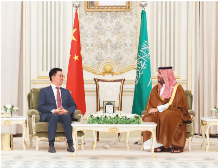
当地时间10月28日至11月1日，应沙特政府邀请，国家副主席韩正访问沙特。这是10月29日，韩正在利雅得会见沙特王储兼首相穆罕默德。