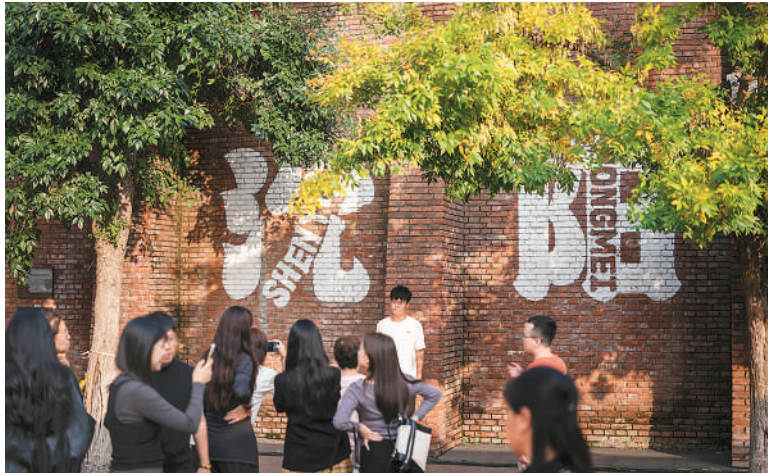
游客在沈阳红梅味精厂旧址游览。

从红梅味精厂到红梅文创园，这里不仅是国家工业遗产，还入选了首批国家级夜间文化和旅游消费集聚区，工业文化的厚重历史与城市生活的崭新变化在此交相辉映。