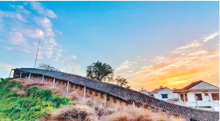
前墅龙窑依山而建。

课，体验并了解陶文化。到了前墅龙窑烧窑的日子，村民将游客的作品拿去烧制，出窑后再寄给大家。据了解，接待研学游客为村民带来了相当可观的收入。随着游客数量增加，村里农家乐、民宿、酒店等也多了起来。 丁蜀镇相关负责人介绍，无锡市拥有许多风格各异的工业遗产，