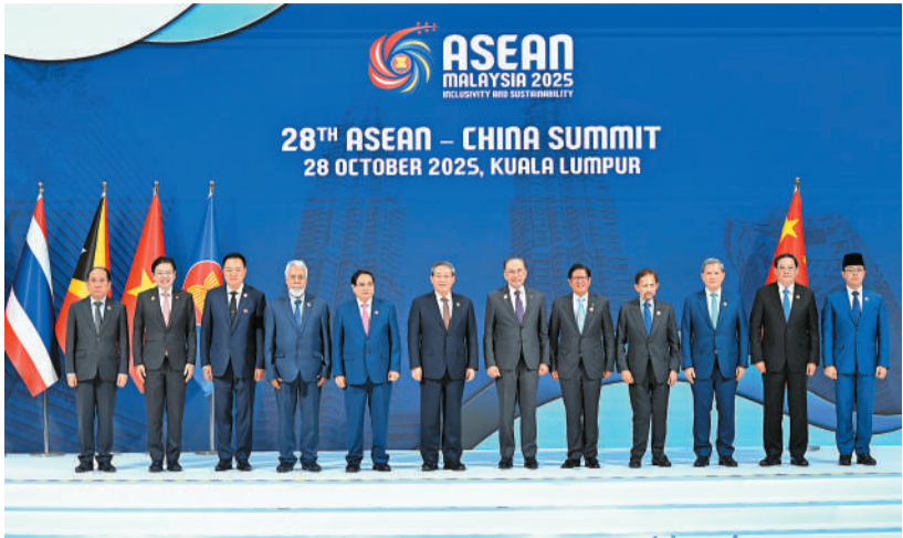
当地时间10月28日，国务院总理李强在马来西亚吉隆坡出席第28次中国—东盟领导人会议。

本报吉隆坡10月28日电（记者章念生、王迪）当地时间10月28日，国务院总理李强在马来西亚吉隆坡出席第28次中国—东盟领导人会议。