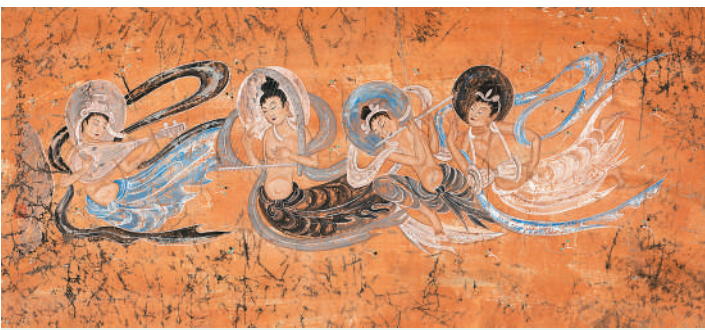
▲敦煌莫高窟伎乐天（纸本岩彩）