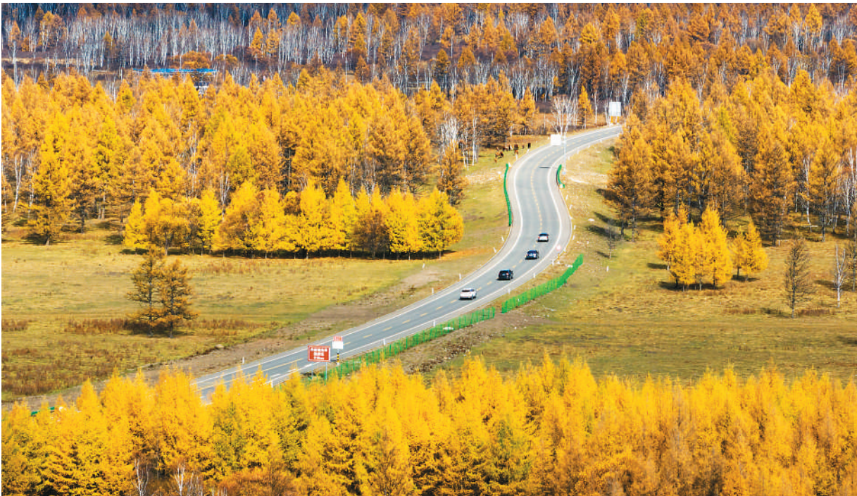
地处大兴安岭山脉中段的内蒙古自治区阿尔山国家森林公园是深受游客喜爱的生态旅游目的地。金秋时节，阿尔山国家森林公园色彩斑斓，游客驾车行驶在景区的公路上，宛如置身画中，将迷人的秋色尽收眼底。

新华社北京9月29日电 （记者袁睿、王慧慧）针对台湾当局新版“海洋政策白皮书”涉钓鱼岛内容，外交部发言人郭嘉昆29日表示，民进党当局颠倒黑白、混淆是非、数典忘祖，完全丧失民族立场，背叛中华民族整体利益。 当日例行记者会上，有记者问：近日台湾当局发布新版“海洋政策白皮书”，称近年来大陆海警船频繁在钓鱼岛周边海域活动,干扰在相关海域的日方舰机和渔船等,借此凸显钓鱼岛主权争议。请问中方对此有何评论？ 郭嘉昆说，钓鱼岛及其附属岛屿是中国固有领土。针对损害中国领土主权的挑衅行动，中国政府当