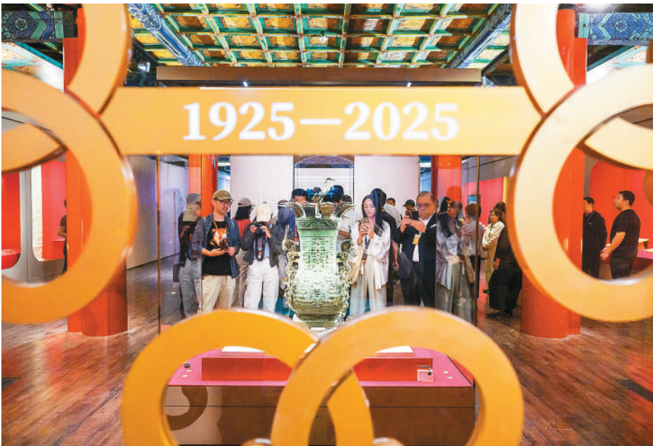
今年是故宫博物院建院100周年。9月29日，“百年守护——从紫禁城到故宫博物院”展览开幕式在北京故宫博物院举行。展览分为“一脉文溯”“百年传承”“万千气象”三个单元,展出文物200件(套),全方位展现故宫博物院发展历程。展览持续至今年12月30日。 图为观众参观青铜莲鹤方壶。