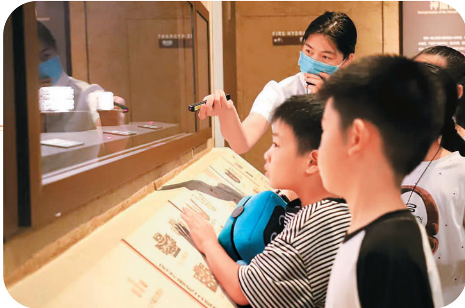
暑假期间，在浙江杭州良渚博物院，中建五局二公司工程建设者的子女们进行参观。在志愿者和讲解老师的引导下，孩子们学习了解中华优秀传统文化知识。

网友“潇浙”：从敦煌到殷墟，再到三星堆，越来越多博物馆成为年轻人争相打卡的网红“顶流”。这几年“博物馆热”持续升温，博物馆里奇思妙想的文化创意、虚拟现实等科技手段，实现了历史与现代、文化与生活的美好交汇。