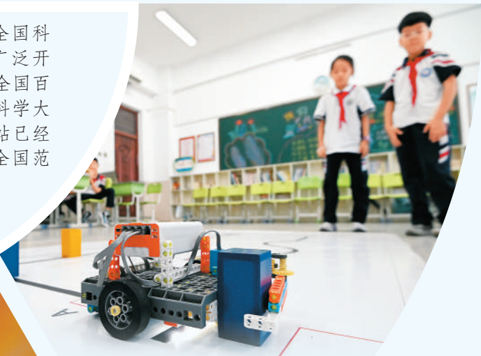
► 河北省邯郸市邯山区首届科学运动会日前在邯山区赵王小学举行，来自邯山区各学校的300多名学生展开角逐。 图为机器人挑战赛现场。

今年9月是科普法修订颁布后的首个全国科普月。科普剧、游园会、科学运动会等活动广泛开展，系列科普地图、科普研学路线陆续发布，全国百家科技馆“科学之夜”持续举行，200多场科学大师剧火热上演……目前，全国科普月平台网站已经汇聚各地活动超过10万场，相关活动已在全国范围拉开帷幕，极大丰富了公众的科普体验。