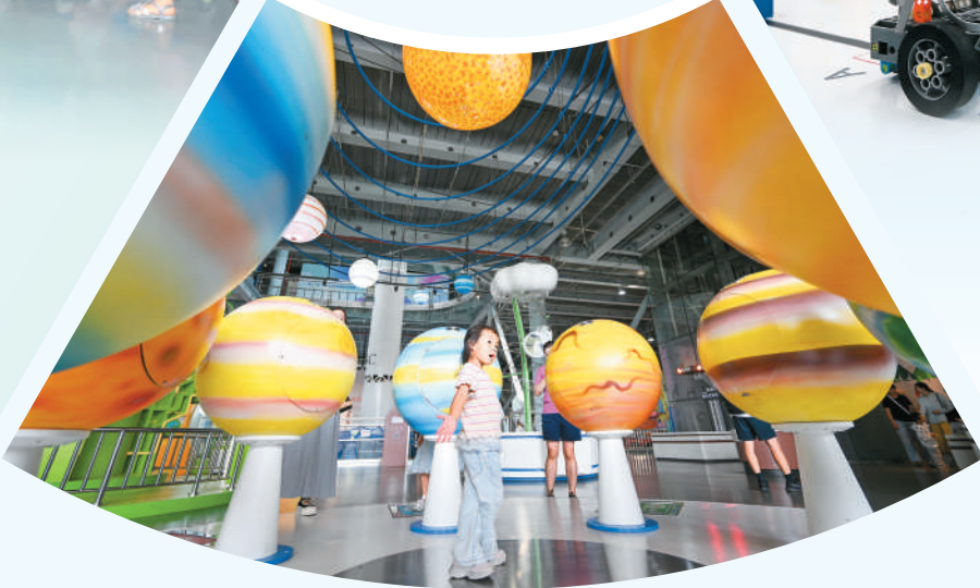
▲ 小朋友在江苏省南京科技馆参观体验。