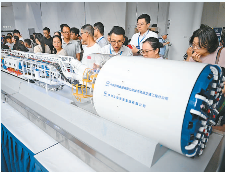
▲ 2025年全国科普月安徽省整合肥市主场活动近日在安徽省科技馆启动。活动为期20天，以“科技改变生活，创新赢得未来”为主题，70余家单位的“硬核”科技亮相现场。 图为观众了解盾构机原理。