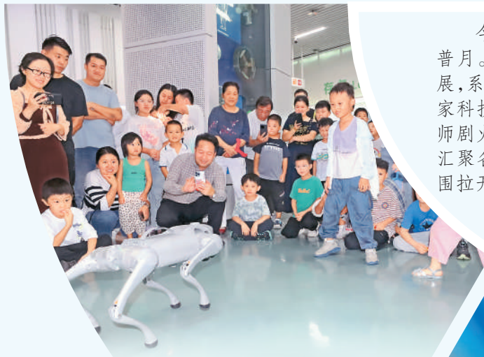
► 在河南省许昌科技馆举办的全国科普月主题科普活动现场，市民观看机器人表演。

今年9月是科普法修订颁布后的首个全国科普月。科普剧、游园会、科学运动会等活动广泛开展，系列科普地图、科普研学路线陆续发布，全国百家科技馆“科学之夜”持续举行，200多场科学大师剧火热上演……目前，全国科普月平台网站已经汇聚各地活动超过10万场，相关活动已在全国范围拉开帷幕，极大丰富了公众的科普体验。