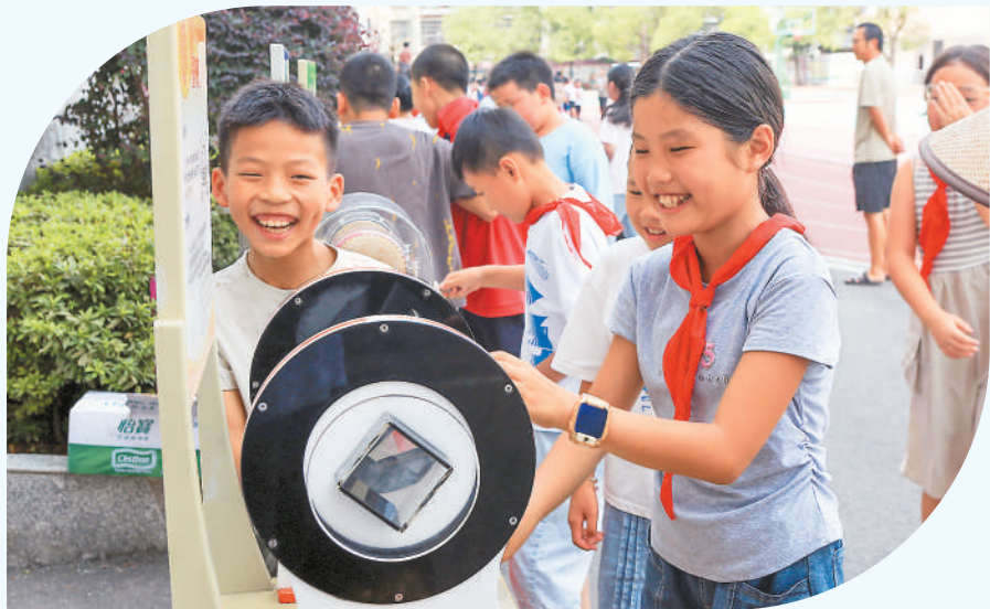
▲ 湖南省湘西土家族苗族自治州龙山县举行“科技改变生活，创新赢得未来”全国科普月科普大篷车进校园活动。 图为龙山县第二小学，学生体验科普设备。