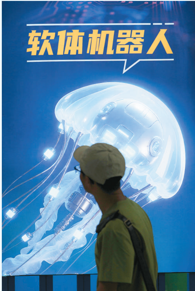
▲ 日前，全国科普月主场活动在北京国家科技传播中心、中国科技馆启幕。 图为参观者在中国科技馆了解软体机器人。