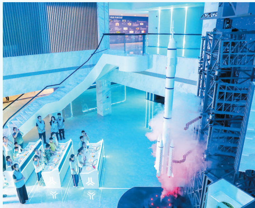
▲ 首个全国科普月期间，位于山东省青岛市莱西市河头店镇的半岛青少年人工智能创新教育实践基地迎来参观热潮。学生们在AI+航天、机器人、元宇宙等展区进行沉浸式体验，感受前沿科技魅力。 图为同学们观看火箭模拟发射。