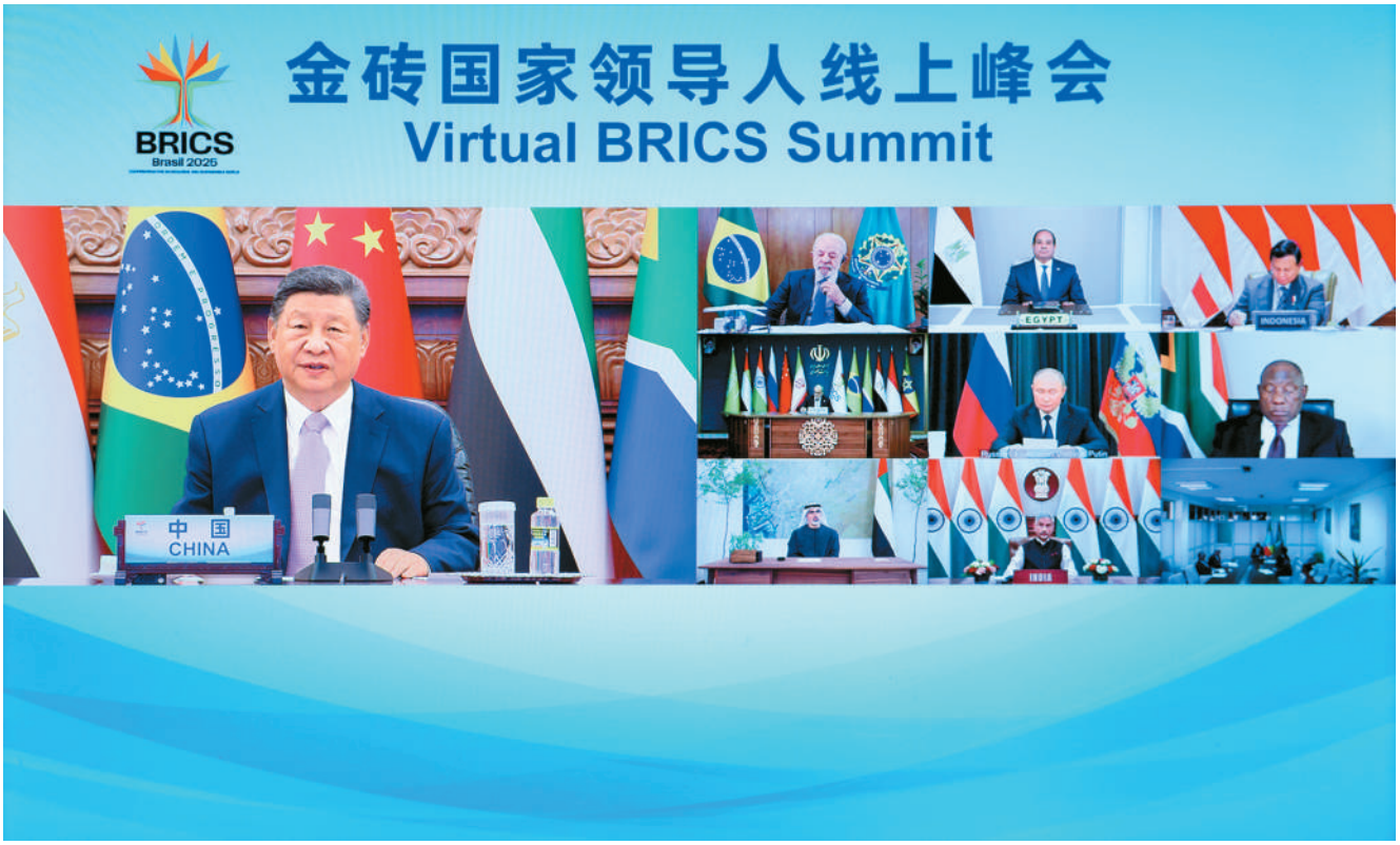
9月8日晚,国家主席习近平出席金砖国家领导人线上峰会,并发表题为《团结合作 砥砺前行》的重要讲话。

本报北京9月8日电 (记者胡泽曦) 9月8日晚,国家主席习近平出席金砖国家领导人线上峰会,并发表题为《团结合作 砥砺前行》的重要讲话。