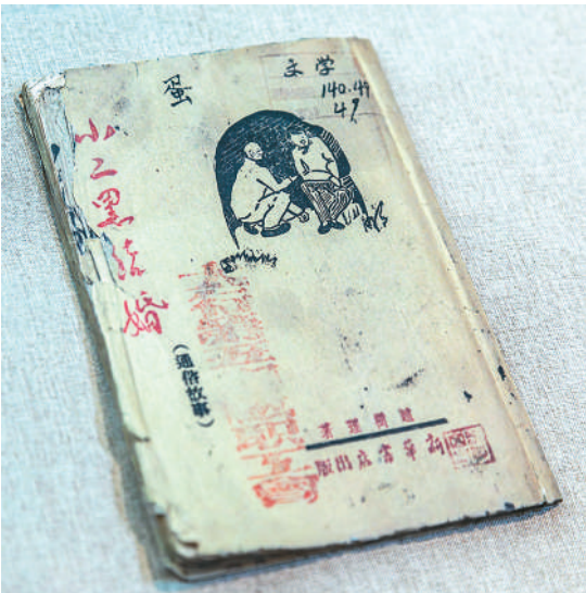
▲新华书店出版的赵树理作品《小二黑结婚》。