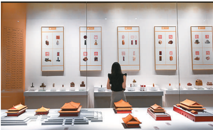
▲清代宫廷玺印。 ▲参观者欣赏展品。