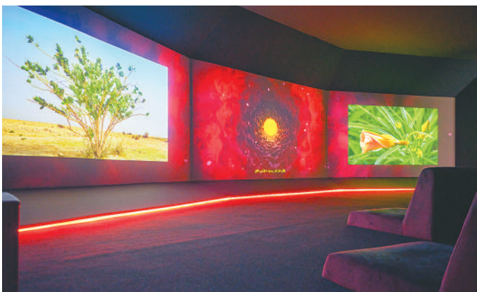
▲展出的作品《沙漠守护者》。

今年，山西博物院还计划利用馆藏革命文物推出“731”主题展览，在学校、社区、党政机关举办抗日主题图片展，进一步弘扬伟大抗战精神。