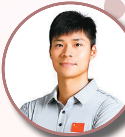
暨南大学体育学院院长、国际级运动健将 苏炳添

全运会的脚步越来越近，体育将成为一座连接全球华侨华人爱国梦的桥梁。在此，我诚挚邀请四海同胞，与我一同全力奔跑，共赴这场全民体育盛会，共赴湾区未来。