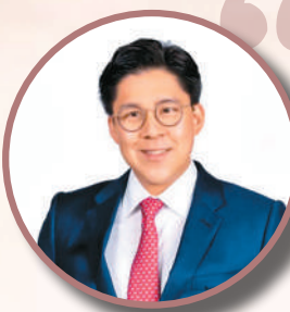
粤港澳大湾区体育文化研究院院长、中国香港体育协会暨奥林匹克委员会副会长 霍启刚

gzqbhb@gz.gov.cn 邮件标题格式：全运家书+姓名 (请在邮件中备注联系方式) 广州华侨博物馆前台“全运信箱”处 (广州市越秀区沿江西路183号)