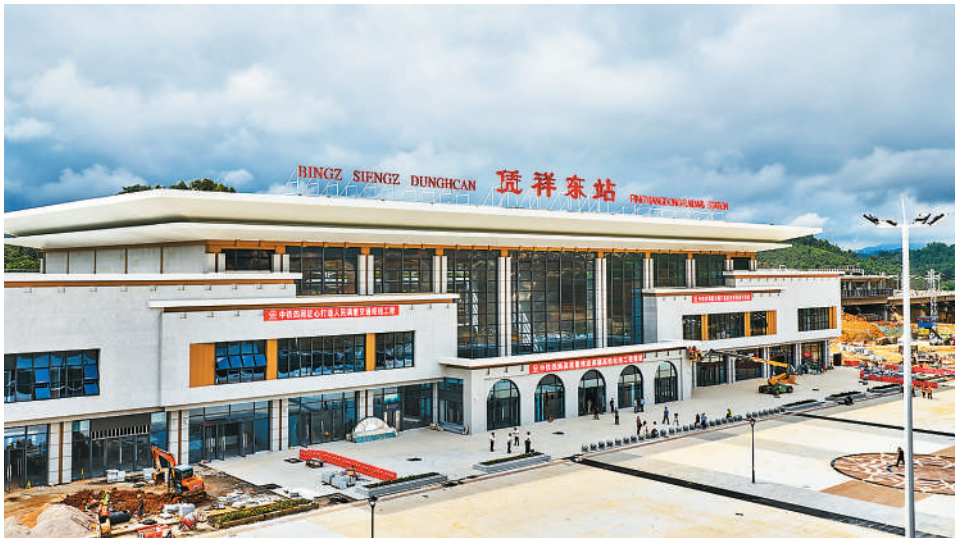
图为新建凭祥东站。

水偏多，植被长势好于常年。南方丘陵山地带气温偏高，降水量接近常年，植被生态质量好于常年和2023年。海岸带水热条件适宜，植被净初级生产力较常年增加7.2%。 2024年，全国平均霾日数为18.7天，与近5年平均值相比，减少3.4天；全国平均沙尘日数与2000年以来均值持平，共出现了14次沙尘天气过程，较2023年偏少3次。在促进大气环境改善上，气象部门持续提供从短期到中长期无缝隙大气污染气象条件预报，同时，在多源资料融合应用、大气污染的成因和气象气候影响方面持续开展科研攻关。