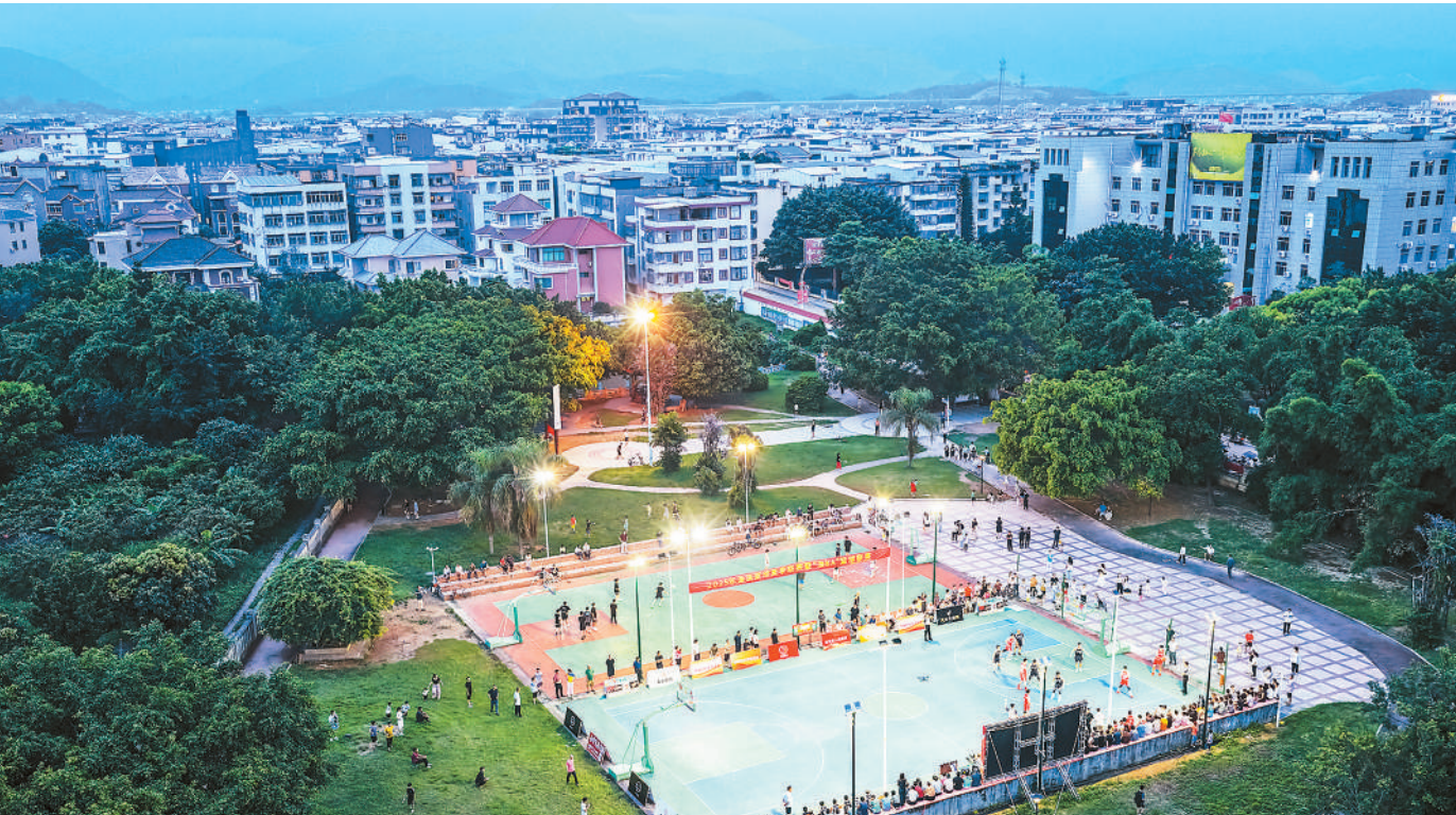
近日，夏季“渔BA”篮球联赛在福建省福清市渔溪镇火热开赛。本次赛事为期21天，吸引15支球队的200多名职工、渔民等业余篮球爱好者参与，共赴这场乡村体育盛会。图为夏季“渔BA”篮球联赛比赛现场。