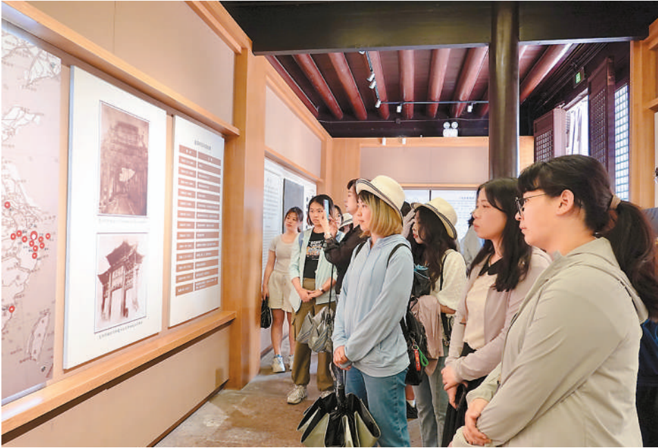
图为在宁波“阳明文化研习营”活动中，两岸青年了解阳明文化。

一些实习活动还融入了文化体验环节。作为2025陕台文化交流周系列活动之一的台湾青年实习就业研习营近日走进陕西，60余名研习营成员前往西安交通大学、黄帝陵、秦始皇帝陵博物院、陕西历史博物馆等地参观，感受陕西深厚的历史底蕴和人文魅力。之后，他们将