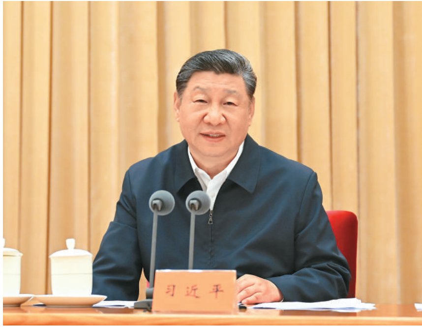
7月14日至15日,中央城市工作会议在北京举行。中共中央总书记、国家主席、中央军委主席习近平出席会议并发表重要讲话。

■当前和今后一个时期城市工作的总体要求是:坚持以习近平新时代中国特色社会主义思想为指导,深入贯彻党的二十大和二十届二中、三中全会精神,全面贯彻习近平总书记关于城市工作的重要论述,坚持和加强党的全面领导,认真践行人民城市理念,坚持稳中求进工作总基调,坚持因地制宜、分类指导,以建设创新、宜居、美丽、韧性、文明、智慧的现代化人民城市为目标,以推动城市高质量发展为主题,以坚持城市内涵式发展为主线,以推进城市更新为重要抓手,大力推动城市结构优化、动能转换、品质提升、绿色转型、文脉赓续、治理增效,牢牢守住城市安全底线,走出一条中国特色城市现代化新路子