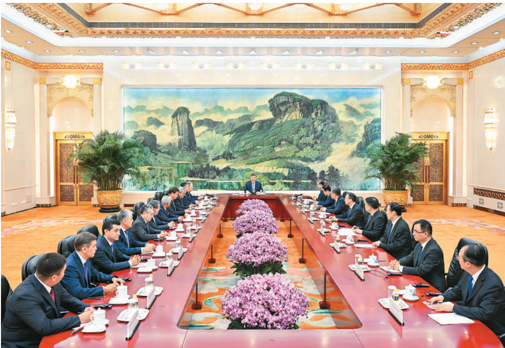
七月十五日上午,国家主席习近平在北京人民大会堂集体会见来华出席上海合作组织成员国外长理事会会议的各国外长和常驻机构负责人。

新华社北京7月15日电(记者孙奕、朱超)7月15日上午,国家主席习近平在北京人民大会堂集体会见来华出席上海合作组织成员国外长理事会会议的各国外长和常驻机构负责人。