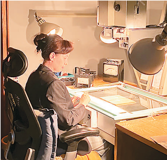
▲工作人员正在对文献进行缩微拍摄。