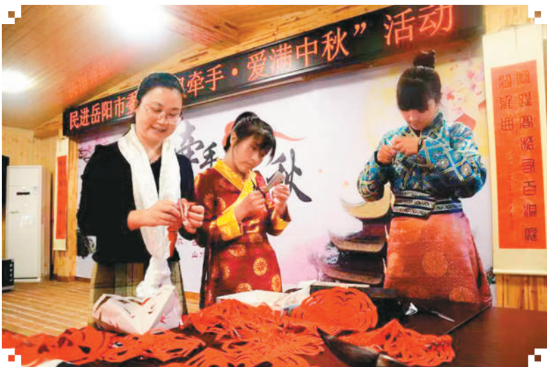
图为民族职业学院的藏族学生参与中秋剪纸活动。