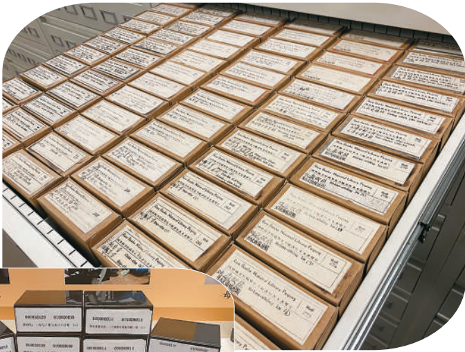
▲国家图书馆库房保存的缩微胶片。