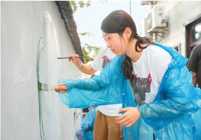
在浙江省湖州市德清县舞阳街道上柏村，来自华东理工大学艺术与传媒学院暑期研学团的学生正在手绘创意墙画，扮靓乡村环境。