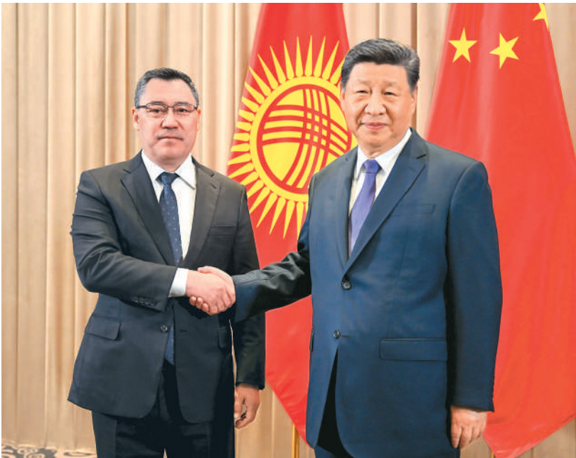
当地时间六月十七日上午，国家主席习近平在阿斯塔纳出席第二届中国—中亚峰会期间会见吉尔吉斯斯坦总统扎帕罗夫。