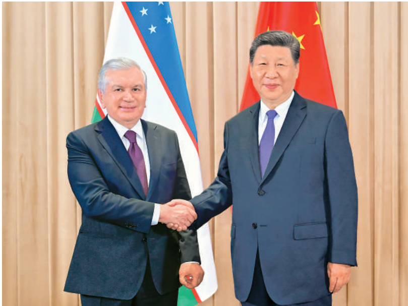
当地时间六月十七日上午，国家主席习近平在阿斯塔纳出席第二届中国—中亚峰会期间会见乌兹别克斯坦总统米尔济约耶夫。