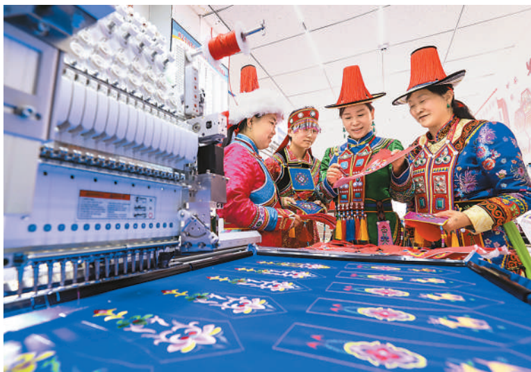
近年来，甘肃省张掖市肃南裕固族自治县依托丰富的非物质文化遗产资源优势，多措并举引导和支持非遗与科技融合创新，让传统文化在数字时代绽放新光彩。图为6月5日，肃南裕固族自治县非遗传承技艺大师工作室，非物质文化遗产裕固族服饰传承人正在查看数字刺绣机刺绣的质量。

湖泊堤坝、水库、重要海堤等涉及防洪安全的水利工程设施、重点工程深入开展隐患排查，全力做好水毁灾损水利工程修复等各项防汛备汛工作，助力保障主汛期安全度汛。