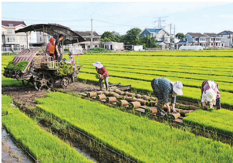
“三夏”时节，江苏省太仓市农民抢抓农时，做好水稻插秧，确保不误农时，助力增产增收。图为6月6日，在太仓市沙溪镇虹桥村，农民在秧田间起秧苗。

中国水博览会创办于2006年，经过多年发展，已成为中国水利行业规模最大、影响力最广的专业展览活动之一。