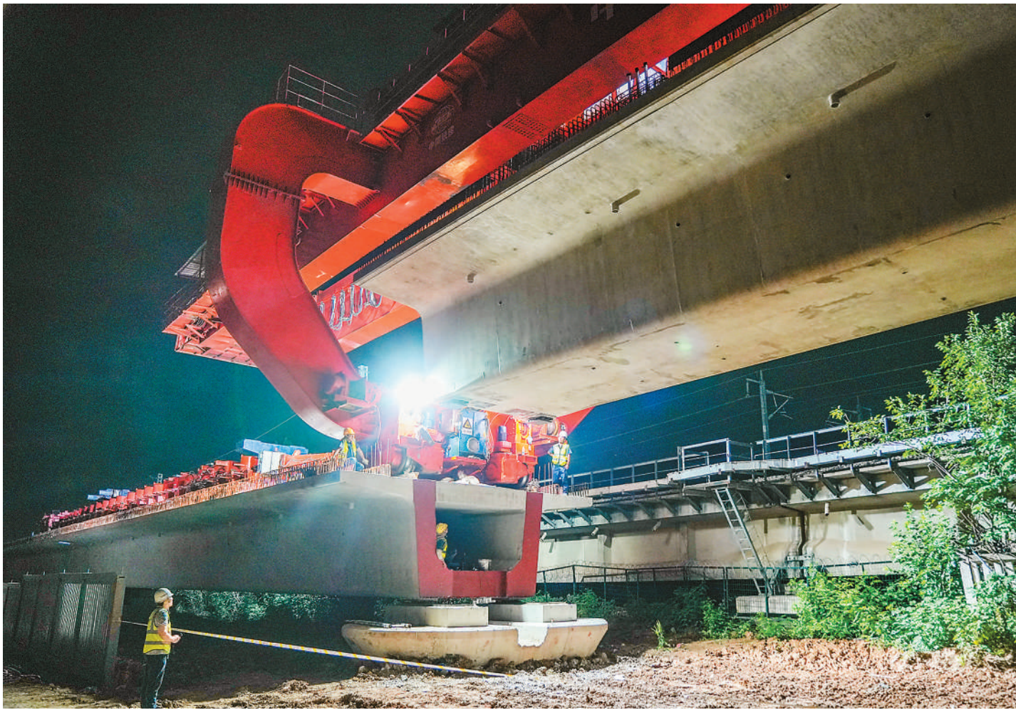
6月6日凌晨，在位于安徽省蚌埠市龙子湖区长淮卫镇的淮宿蚌城际铁路建设现场，最后一根简支箱梁精准架设在蚌埠南右线特大桥48号墩至49号墩间，标志着淮宿蚌城际铁路全线架梁任务顺利完成，为后续无砟轨道、牵引供电等工程施工奠定了坚实基础。