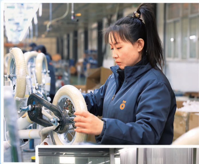
位于邢台市平乡县的邢台金天儿童用品有限公司车间内，工人正在组装童车。

在全国率先实行企扫码，规范执法检查行为；创新设立市级产业集群服务中心，精准解决企业诉求；推出《优化营商环境部门改革举措清单》，进一步简化办理流程、缩短办事时限、提高办事效率……亲商爱商正在成为邢台市政务服务的新常态，2024年全面落实助企帮扶系列政策，新增退减缓税费35.58亿元，新增贷款664.35亿元。截至2025年3月底，邢台市经营主体总量达到97.90万户，同比增长5.33%。