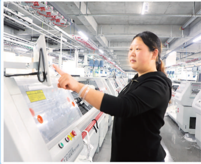
位于邢台市清河县的河北新华羊绒制品有限公司针织共享车间内，工人正在操作电脑横机。