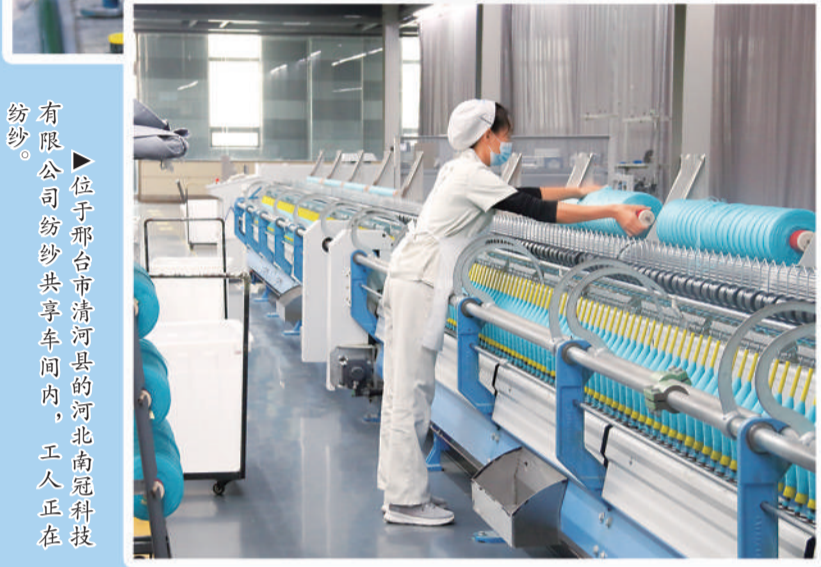
位于邢台市清河县的河北南冠科技纺纱有限公司纺纱共享车间内，工人正在纺纱。