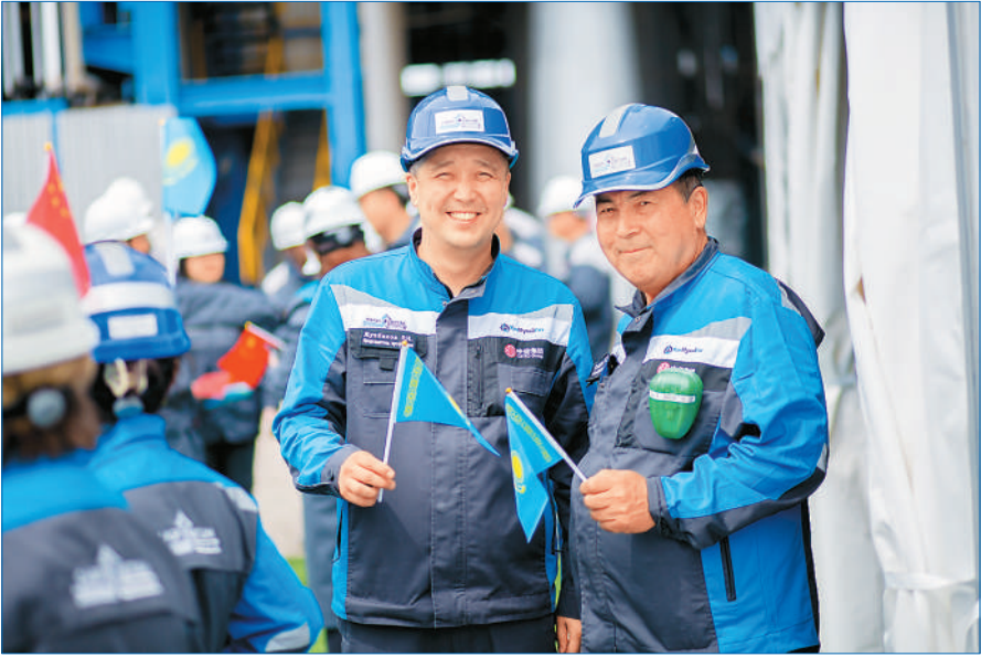
五月五日，员工参加在哈萨克斯坦阿克套举行的里海沥青厂扩能升级改造项目投产仪式。

中国车带给哈萨克斯坦的不只是性价比高的车。近年来，哈萨克斯坦汽车产业发展迅速，政府积极吸引投资并推动本地化生产。2025年，一批新工厂的投产将进一步完善汽车产业链，增强国内供应能力，同时拓展出口市场。其中，位于阿拉木图的多品牌汽车制造厂将生产长安、奇瑞和哈弗三大品牌汽车，可提供3600个就业岗位。而且，伴随汽车制造业的发展，相关配套产业，如零部件生产、物流和售后服务等，也迎来新的增长机遇。