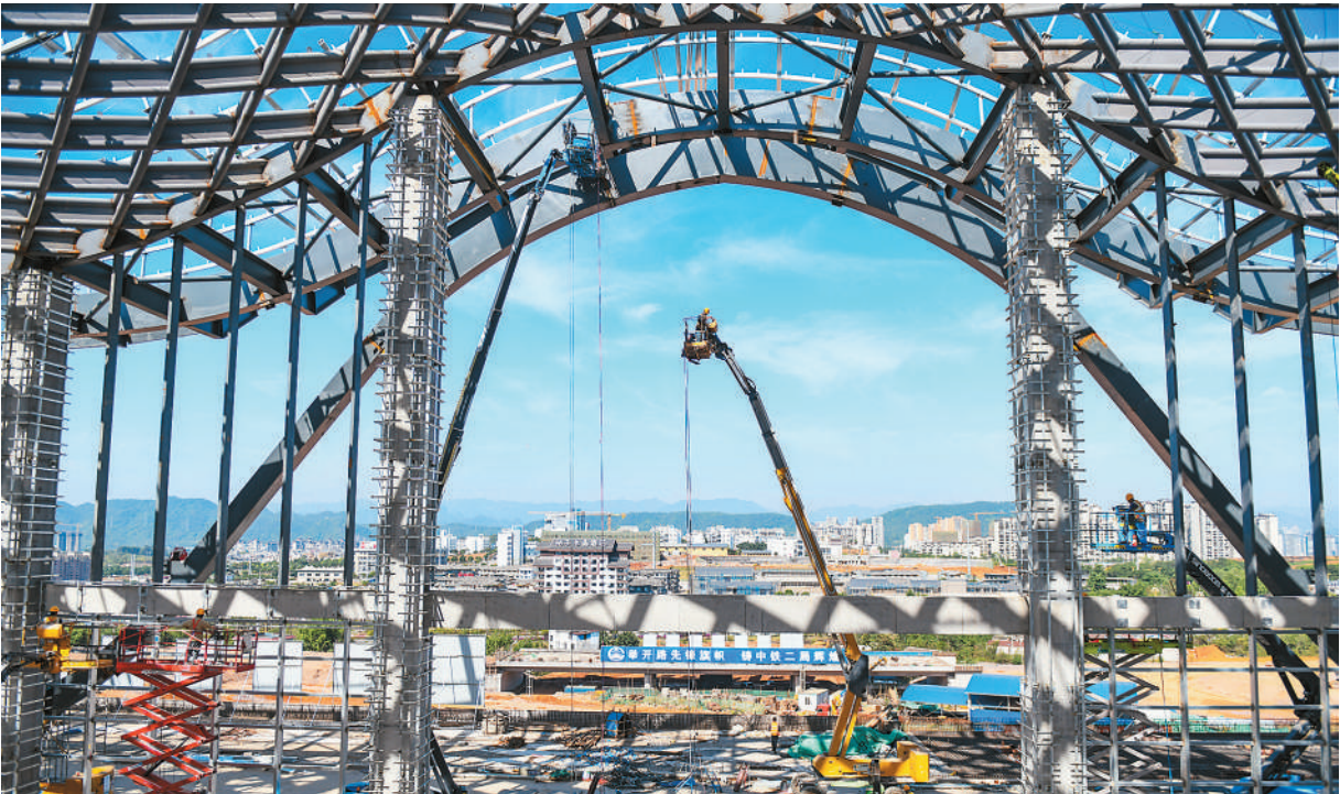
贵州省盘（州）兴（义）铁路全长约98公里，设计时速250公里，建成后将实现贵阳市至兴义市2小时内直达，大幅缩短黔西南地区与省会城市的时空距离。图为盘兴铁路兴义南站施工现场。

研发机构之江实验室了解到，随着太空计算卫星星座14日在酒泉卫星发射中心成功发射，中国首个整轨互联太空计算星座“三体计算星座”正式进入组网阶段。 这是之江实验室主导构建的“三体计算星座”的首次发射，也是国星宇航“星算”计划的首次发射。