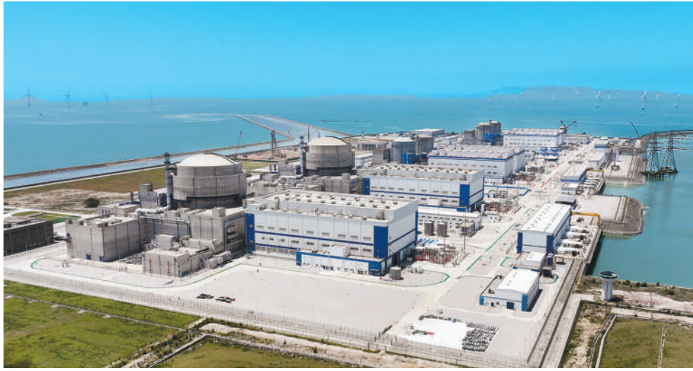
「华龙一号」示范工程所在地中核集团福清核电基地。

本报北京5月14日电（记者谷业凯）记者从中核集团获悉，14日，“华龙一号”全球首堆——中核集团福清核电5号机组实现连续安全稳定运行1000天，持续向社会稳定输送清洁电力超370亿千瓦时。这一佳绩，再次验证了中国自主三代核电技术“华龙一号”的安全性和先进性，为全球清洁能源发展贡献了中国方案。 “华龙一号”是中国在30余年核电科研、设计、制造、建设和运营经验的基础上，根据全球最新安全要求并采用国际最高安全标准，研发的具有完全自主知识产权的三代压水堆核电创新成果。“华龙一号”单台机组年发电量达