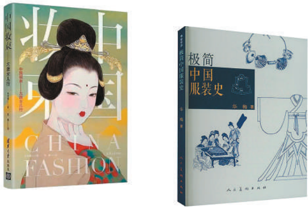
传统服饰主题图书：