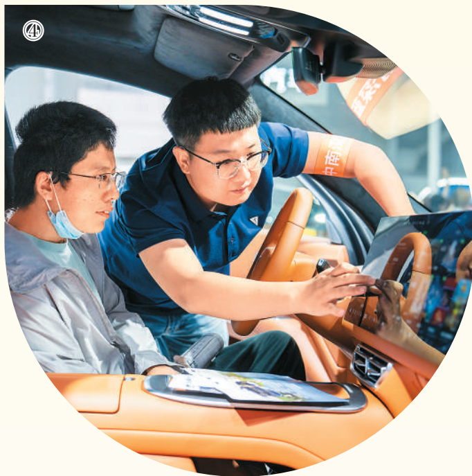
图④：在湖南省长沙市举行的2025湖南汽车展览会上，工作人员（右）向观众介绍展车功能。