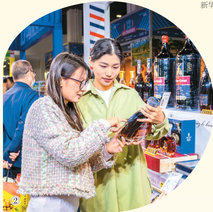
图②：参观者在内蒙古自治区呼和浩特市举行的第十二届中国·内蒙古进出口商品博览会法国展区选购红酒。