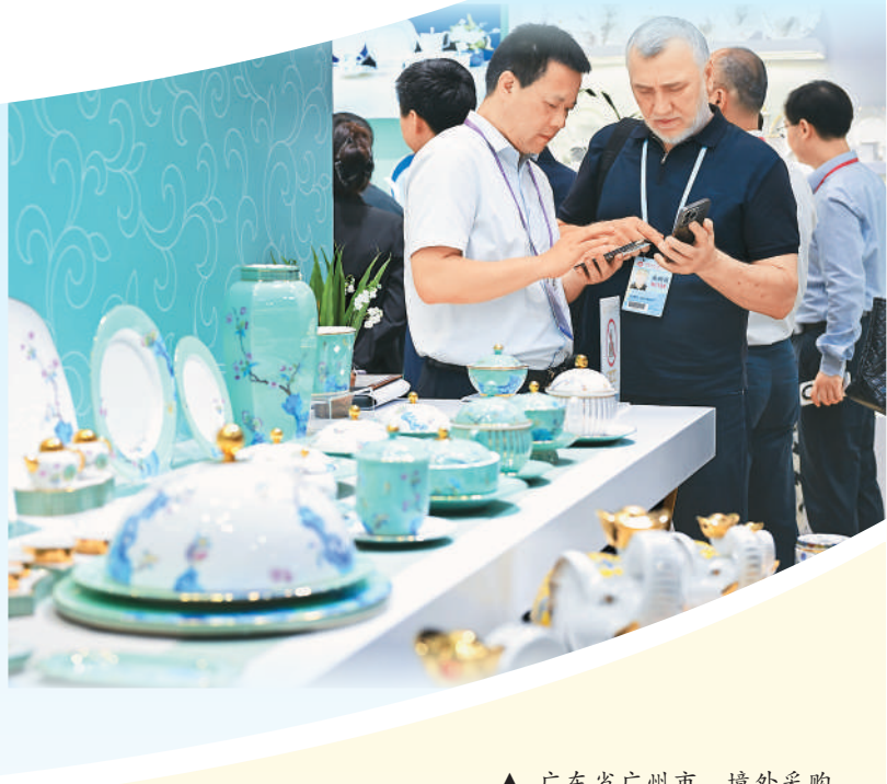
▲ 广东省广州市，境外采购商在第137届中国进出口商品交易会（广交会）瓷器展区洽谈。