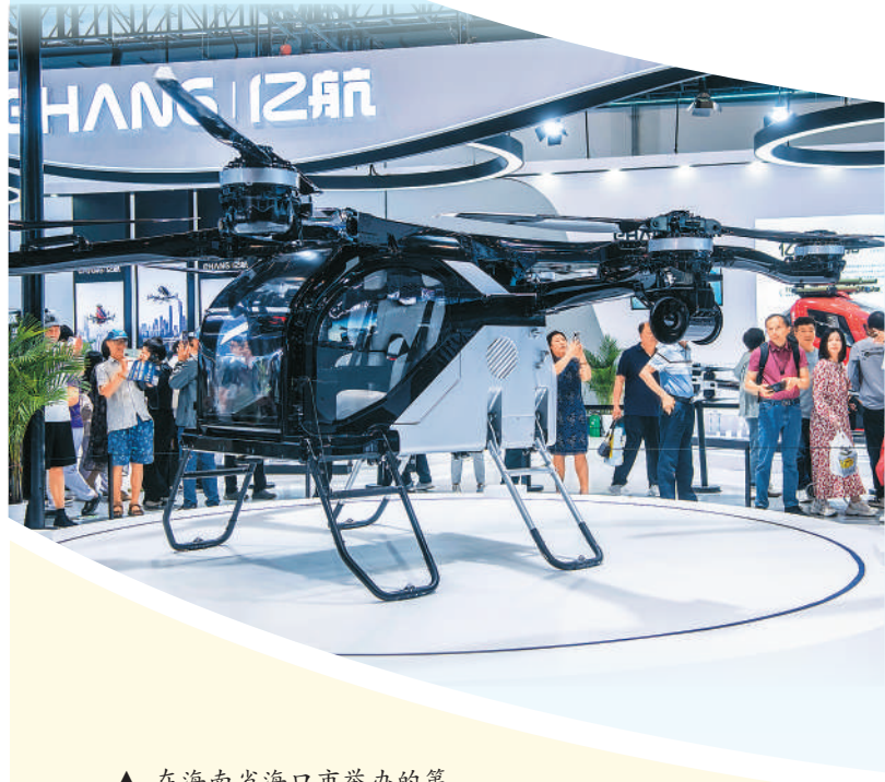
▲ 在海南省海口市举办的第五届中国国际消费品博览会现场，观众在无人机展区参观。

展会是观察经济发展活力和潜力的重要窗口。近来，一场场展会接连举办：第五届消博会吸引了来自71个国家和地区的1700余家消费企业，参展品牌数量超过4100个；被视为中国外贸“晴雨表”“风向标”的广交会，本届吸引参展企业约3.1万家；截至5月4日，共有来自219个国家和地区约28.9万名境外采购商到会，较去年同期增长17.3%，现场意向出口成交254.4亿美元。 场馆内人潮涌动，对接会上合作意向频频达成……一场场展览展会，聚集起人流、物流、信息流，有力带动了贸易、投资、消费、旅游等各行各业发展。展会的火热，向世界展现出中国经济的强劲韧性与无限潜力。