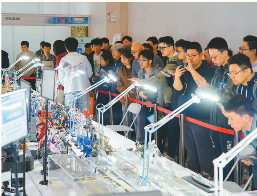
▲ 第二十三届中国国际模型博览会在北京市举行，图为观众参观模型产品。