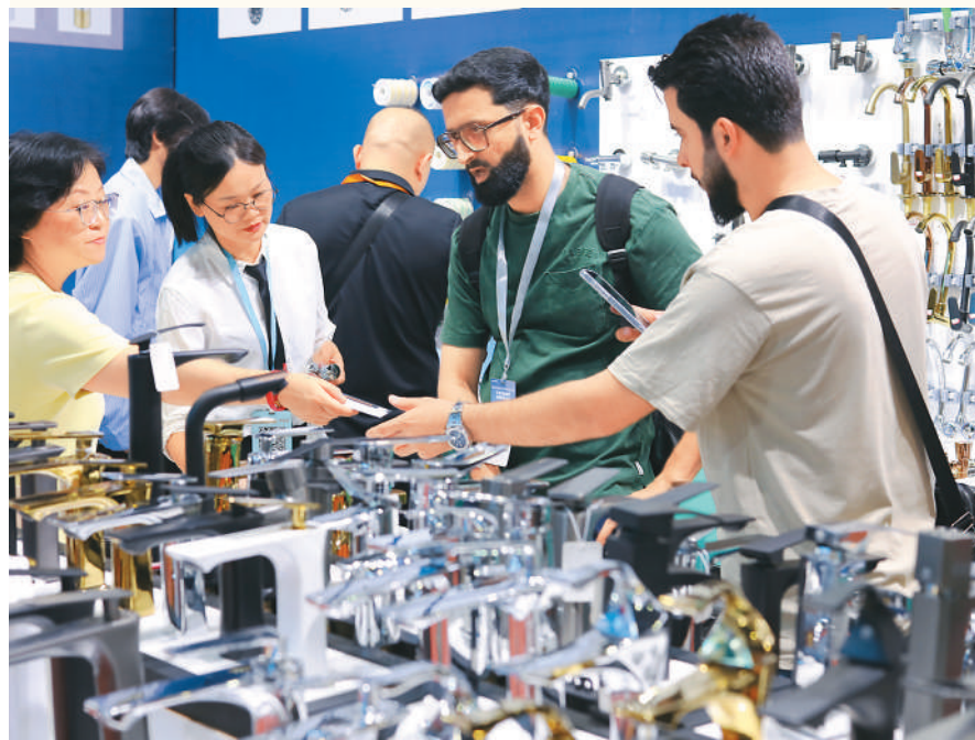
▲ 外商在浙江省义乌市举行的第九届中国义乌国际五金电器博览会上采购水龙头。