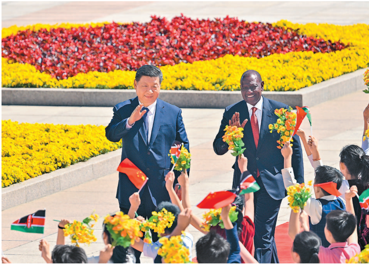
4月24日上午，国家主席习近平在北京人民大会堂同来华进行国事访问的肯尼亚总统鲁托举行会谈。这是会谈前，习近平在人民大会堂东门外广场为鲁托举行欢迎仪式。

新华社北京4月24日电（记者董雪、邵艺博）4月24日上午，国家主席习近平在北京人民大会堂同来华进行国事访问的肯尼亚总统鲁托举行会谈。两国元首一致同意将双边关系定位提升至新时代中肯命运共同体。 习近平指出，建交62年来，中肯双方始终相互尊重、相互支持，传承中非友好合作精神和丝路精神，推动两国全面战略合作伙伴关系不断迈上新台阶。中肯关系提升至新时代中肯命运共同体，是双方的战略选择。中方愿同肯方一道，顺应历史潮流和时代大势，打造新时代全天候中非命运共同体典范，引领中非关系发展和全球南方团结合作。 习近平强调，构建命运共同体是相互尊重、平等相待、互利共赢、“同球共济”的大道正途。中肯双方要继续坚定支持彼此维护国家主权、安全、发展利益，坚定支持彼此探索符合本国国情的发展道路，深化治国理政经验交流，做现代化道路上的同行者和真朋友。共建“一带一路”是两国合作的亮丽名片，要加强常态化政策沟通，推动高水平互联互通，促进可持续贸易畅通，探讨多元化资金融通，赓续世代友好民心相通，做高质量共建“一带一路”的引领者。中国超大规模市场始终对肯尼亚优质产品敞开大门，中方鼓励更多有实力的中国企业赴肯投资兴业。作为全球南方重要成员，中肯两国要以实际行动坚定捍卫以联合国为核心的国际体系，推动共商共建共享的全球治理，践行真正的多边主义，推动构建平等有序的世界多极化、普惠包容的经济全球化，推动世界走向和平、安全、繁荣、进步的光明前景。 习近平指出，无论国际风云如何变幻，中国真实亲诚对非政策理念不会变，中非患难与共、守望相助的初心不会变，中非合作共赢、共同发展的根本宗旨不会变。中国言必信、行必果，愿同包括肯尼亚在内的非洲国家一道，推动中非合作论坛北京峰会成果形成更多早期收获，更好惠及非洲人民，继续发出中非联合自强、团结协作的时代强音，推动以高质量中非合作引领全球南方合作。