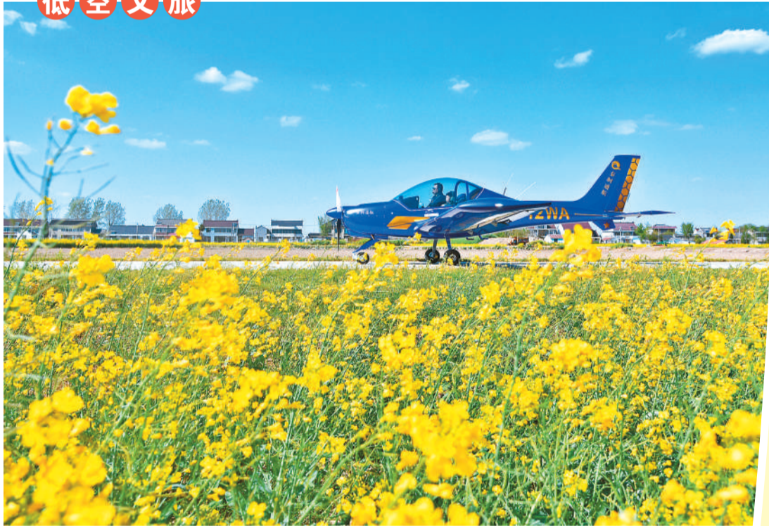
▲ 在江苏省如皋市城北街道平园池村飞行体验基地，一名参加航空研学的学生乘坐轻型运动飞机体验飞行乐趣。