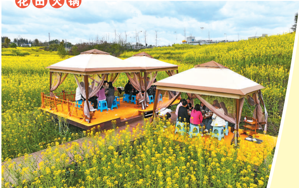
▲ 重庆市梁平区南平镇太平社区，游客们一边欣赏油菜花海，一边享用“花田火锅”，体验别样的春天休闲旅游。