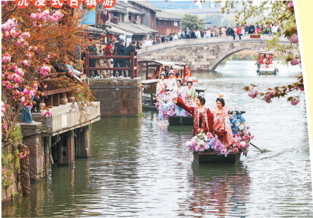
▲ 在浙江省湖州市德清县新市古镇举行的蚕花庙会上，“蚕花娘娘”在船上向游客和蚕农撒蚕花。