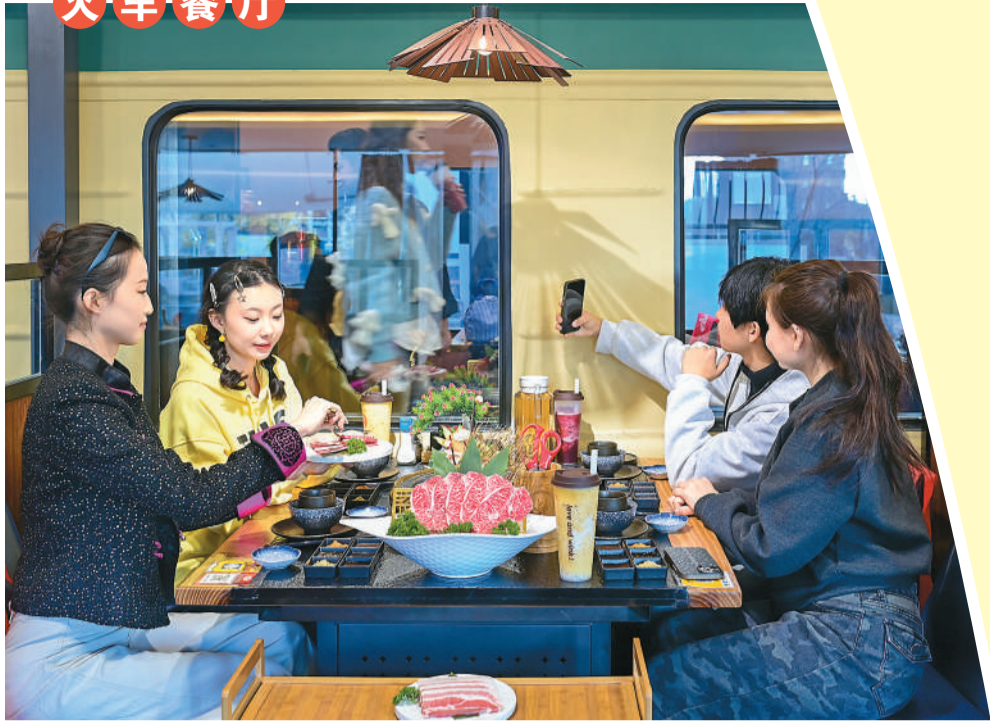
▲ 内蒙古自治区鄂尔多斯市康巴什区将退役火车车厢和客机改建成火车餐厅、飞机餐厅，设置飞行体验空间、自助茶饮空间、自助烤肉空间等多个混搭业态，丰富餐饮消费场景和产品供给。图为顾客在火车餐厅体验自助烤肉。