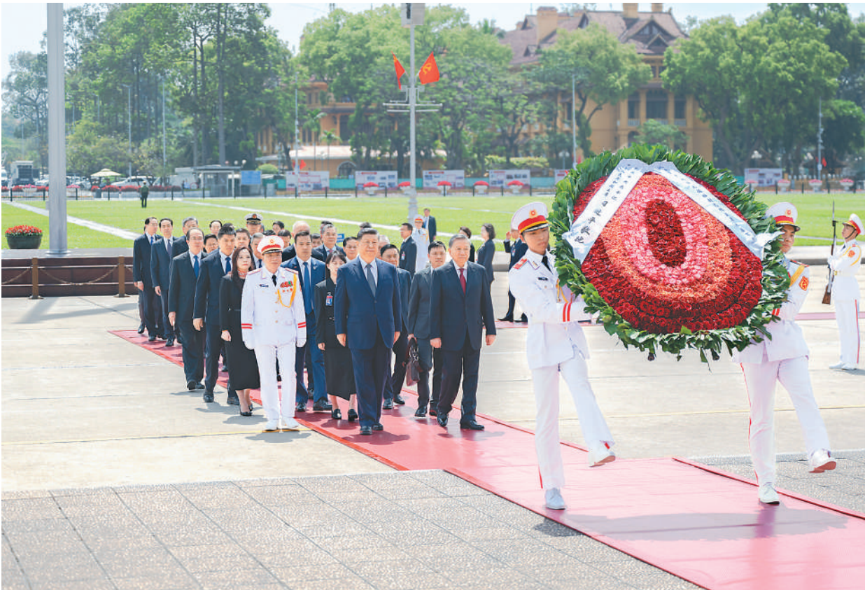
4月15日上午，在越共中央总书记苏林陪同下，中共中央总书记、国家主席习近平瞻仰胡志明陵并敬献花圈。