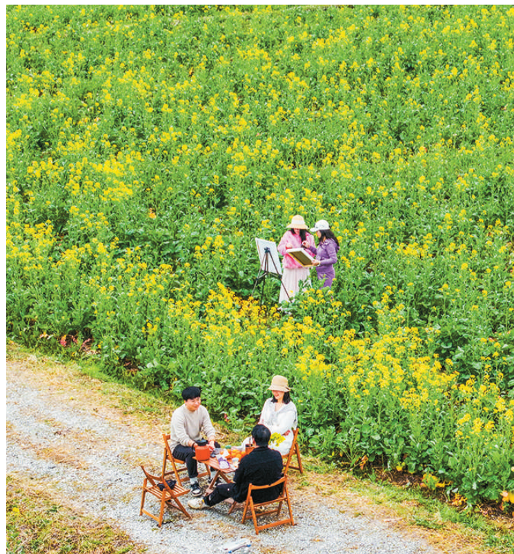
近日,江西省抚州市南丰县琴城镇水北村的油菜花竞相绽放,吸引不少游人前来踏青赏花,感受春天的气息。图为2月28日,游客在花田间游玩。

飞行小时的飞行任务,其中包含颤振、飞行载荷、高速特性、失速、空中最小操纵速度、最小离地速度、最大能量刹车中止起飞等高风险试飞科目。面对高风险科目,试飞团队严格程序,严控风险,确保绝对试飞安全,从试飞科目、保障条件、试飞环境、保障设备等方面充分开展了危险源识别,结合试飞科目的实施进度,将风险缓解与控制措施落实到试飞组织中,严守试飞安全底线,确保型号试飞任务安全顺利完成。