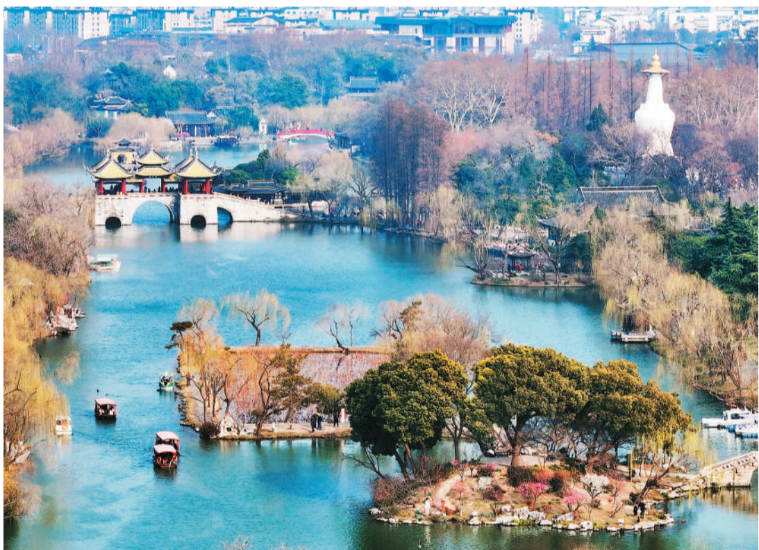
早春时节,天气渐暖,江苏省扬州市瘦西湖风景区春意盎然,红梅争艳,柳芽新绽,呈现出美丽的春日景色。图为二月二十八日的瘦西湖风景区春景。

文章指出,经济工作千头万绪,必须统筹好几对重要关系。一是必须统筹好有效市场和有为政府的关系,形成既“放得活”又“管得住”的经济秩序。政府要有所为、有所不为,解决好缺位、越位问题。政府行为越规范,市场作用就越有效。二是必须统筹好总供给和总需求的关系,畅通国民经济循环。要坚持供需两侧协同发力、动态平衡,持续深化供给侧结构性改革。要加快补上内需特别是消费短板,使内需成为拉动经济增长的主动力和稳定锚。三是必须统筹好培育新动能和更新旧动能的关系,因地制宜发展新质生产力。要以科技创新为引领,大力培育壮大新兴产业和未来产业,加快推动作为经济增长和就业收入基本依托的传统产业改造升级,推动新旧发展动能平稳接续转换。四是必须统筹好做优增量和盘活存量的关系,全面提高资源配置效率。善于通过盘活存量来带动增量,统筹做优增量和盘活存量、管好资产和调整负债,拓展新的发展空间。五是必须统筹好提升质量和做大总量的关系,夯实中国式现代化的物质基础。要坚持以质取胜和发挥规模效应相统一,把质的有效提升和量的合理增长统一于高质量发展的全过程。