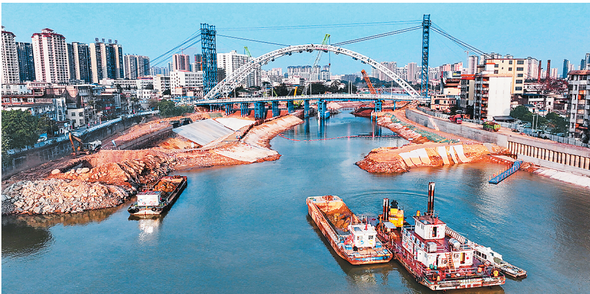
春节假期期间，平陆运河建设工地热火朝天。平陆运河始于广西南宁横州市西津库区平塘江口，经钦州灵山县陆屋镇沿钦江进入北部湾，全长约134.2公里，建成后将在我国西南地区开辟一条由西江干流向南入海的江海联运大通道。图为建设中的钦州一桥。

发布会上，何咏前还就就将美国PVH集团和因美纳公司列入不可靠实体清单的有关记者提问进行了回应。她说，美国PVH集团和因美纳公司存在违反正常的市场交易原则，中断与中国企业的正常交易，对中国企业采取歧视性措施等行为，中方依法将上述两家实体列入不可靠实体清单。后续中方将依据相关法律法规，对上述实体采取相应措施。