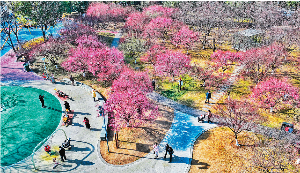
2月6日，安徽省合肥市蜀山区绿轴公园梅花绽放，景美如画。