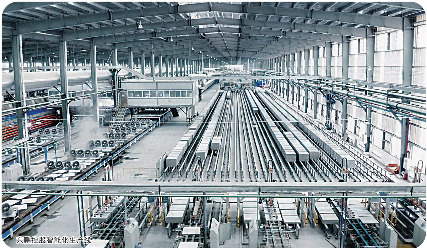
东鹏控股智能化生产线