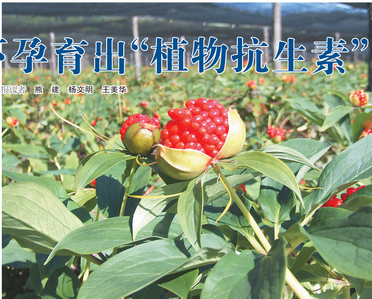
这是滇重楼的果实，红润可人。