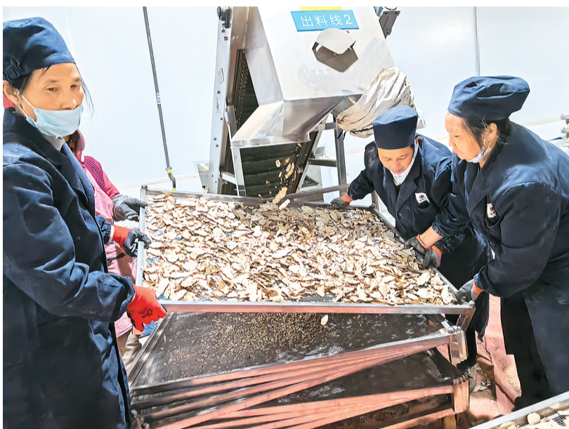
在云南白药集团太安生物科技产业有限公司的生产车间，工人们把机器加工好的滇重楼切片进行分拣作业。