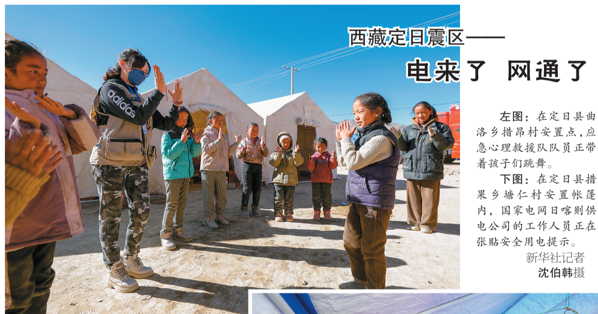
西藏定日震区—— 电来了 网通了