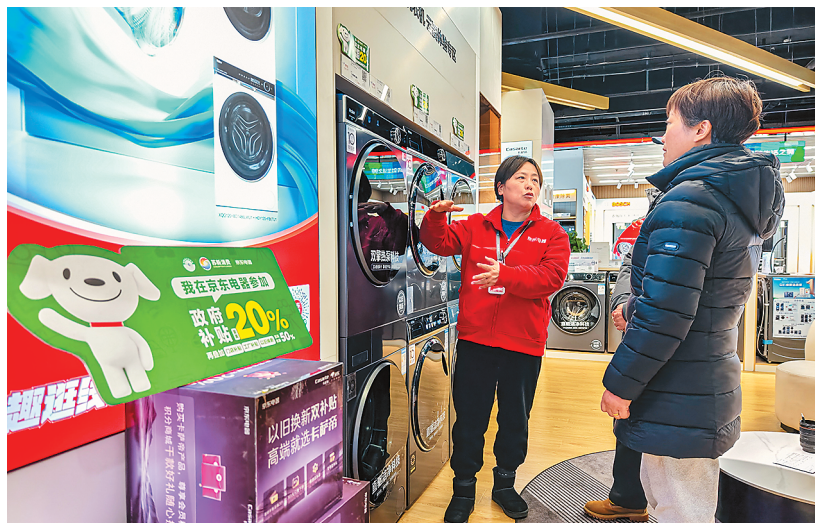
近日，江苏省正式启动“苏新消费·暖冬购物季”主题促消费系列活动。活动聚焦家电、家装、汽车、电动自行车以旧换新等重点领域，推出上千场消费促进活动。图为昆山市一家电门店工作人员向消费者介绍参与政府补贴活动的洗衣机。