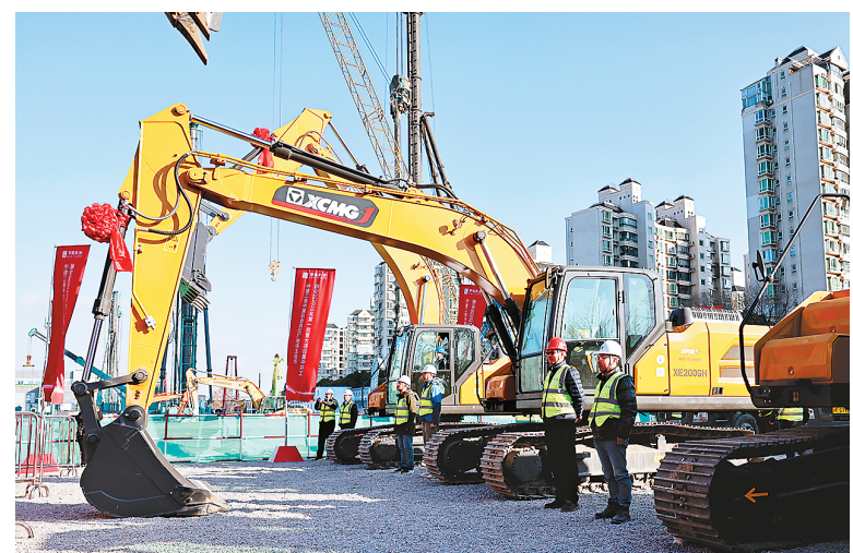
1月9日，上海市静安区2025年第一批重大项目集中开工仪式在灵石社区（自仪厂地块）项目现场举行，包括该项目在内的总投资超180亿元的建设工程全面启动。图为开工仪式现场。

登记失业人员等劳动者就业创业。二是聚焦农村劳动力，于1月至3月开展“春风行动”，促进农村劳动力就近就业和返乡创业。三是聚焦高校毕业生等青年群体，接续实施春秋两季的全国城市联合招聘高校毕业生专场活动、百日千万招聘专项行动等6项活动，提供政策落实、权益保护、困难帮扶等服务，促进高校毕业生等青年就业创业。四是聚焦民营企业、中小企业等用人单位，于4月、10月组织民营企业服务月和金秋招聘月2项活动，提升涉企服务实效，促进人力资源供需对接。