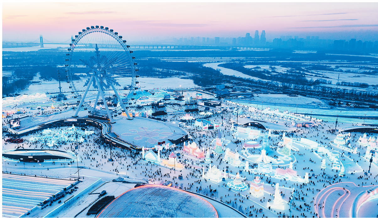
游客在哈尔滨冰雪大世界园区游玩(无人机照片)。