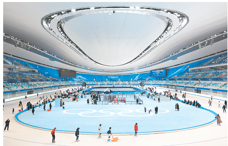
游客在北京国家速滑馆滑冰。