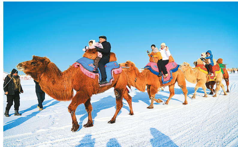
游客在新疆博湖县博斯腾湖大河口景区体验雪地骆驼。

《报告》显示,据不完全统计,截至2024年底,我国共有3684个冰雪景区景点,其中,滑冰运动场馆共计1970个,滑雪场719个,新兴类型995个。新兴类型中涵盖亲子乐园、主题乐园、动物园、冬季休闲滑雪、休闲娱乐等多种类型。这些景区不仅丰富了冰雪旅游产品的供给,也满足了不同游客群体的需求。