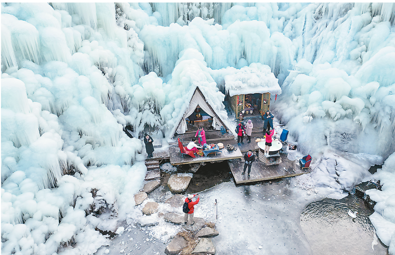
游客在山东济南九如山风景区欣赏冰瀑景观。

中国旅游研究院院长戴斌表示,要加快建设冰雪旅游强国。借鉴发达国家的发展经验,做好冰雪旅游专项规划,明确冰雪旅游在旅游强国、文化强国建设中所扮演的角色和应当发挥的作用。结合冰雪旅游目的地建设,建设一批文化底蕴深厚的世界级旅游景区和度假区,文化特色鲜明的城市和休闲街区以及世界级、国家级旅游线路。在目的地形象、市场推广、基础设施、公共服务和重点项目上,重点完善接待体系,构建主客共享的美好生活新空间,推动旅游目的地从冬季旅游走向四季旅游。