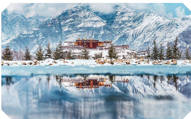
冰雪梦·华夏行主题图片展中的作品《雪山共冰湖一色——布拉达拉宫》。该图片展系2025中国冰雪旅游海外推广季系列活动之一。