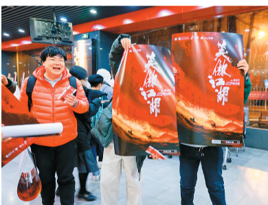
▲4K修复版《笑傲江湖》放映前，影迷领取纪念海报。 ▼“经典香港电影修复计划”专题展《笑傲江湖》放映现场。