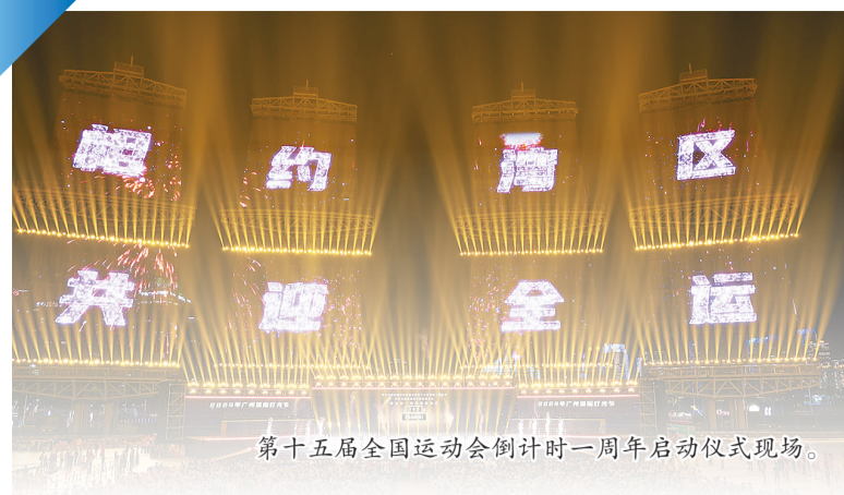
第十五届全国运动会倒计时一周年启动仪式现场。