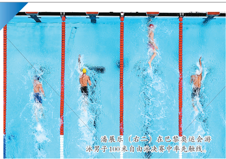
潘展乐（右二）在巴黎奥运会游泳男子100米自由泳决赛中率先触线。

此外，有“小奥运会”之称的大运会和大冬会将在今年举行，举办地分别为德国莱茵鲁尔和意大利都灵。