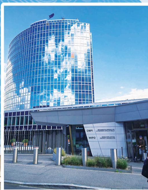
▲世界知识产权组织总部。资料图片