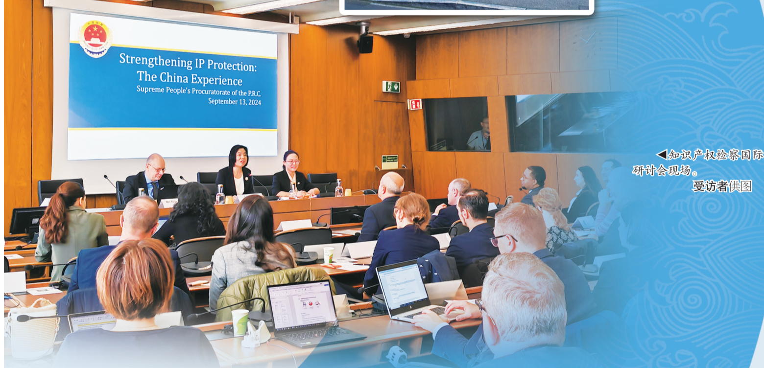
▲知识产权检察国际研讨会现场。