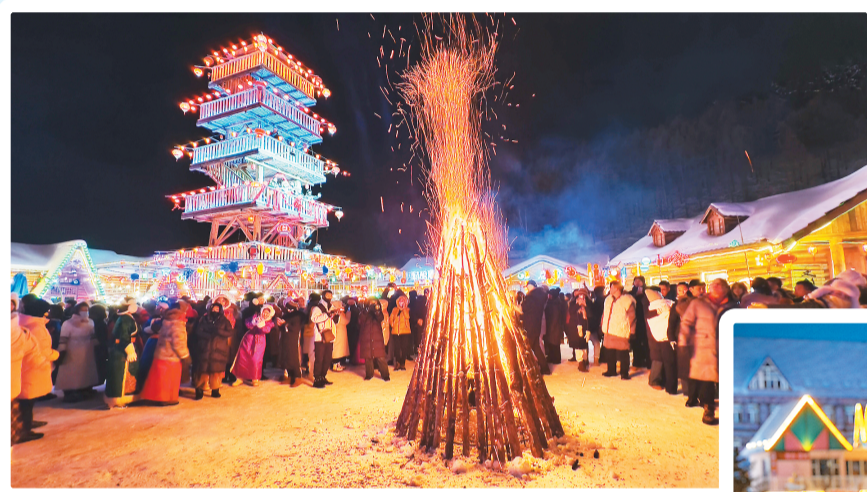
2024年12月31日晚，在阿尔山市雪村，随着篝火点燃，来自全国各地的游客在这里欣赏烟花，共同跨年。

2024年12月31日，由中共兴安盟委员会宣传部主办，兴安盟文化旅游体育局、乌兰浩特市、阿尔山市、科右前旗协办的“冰雪兴安·活力中国”主题采访活动在兴安盟阿尔山市启动。本报记者跟随采访团来到这里，从雪山到草原，跨越270多公里，实地采访兴安盟发展冰雪经济的创新故事，与各地游客一同沉浸式感受冬日兴安盟的欢乐与激情。